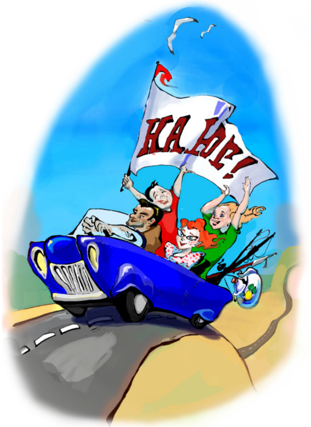
Рис. Д. Серебряной

Снова ж имолость цветёт... Ж ирный карп по дну плывёт, На костре у ш ицы сварим Вот та-а-акущий котелок! Нас ш икарный, долгожданный,