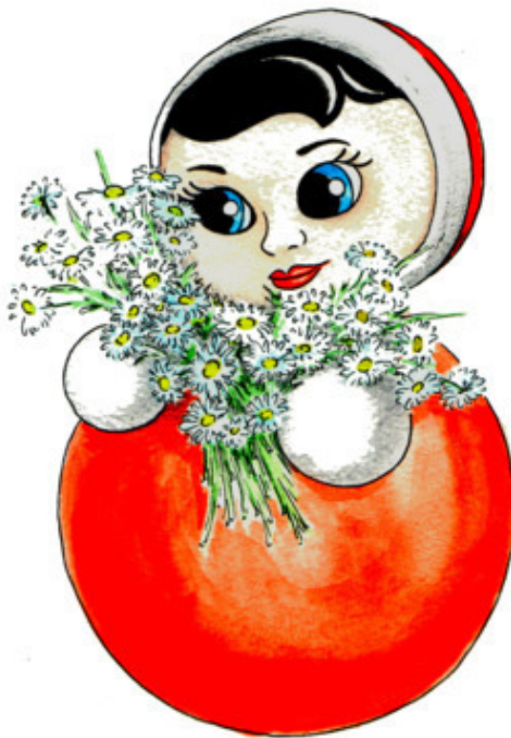
Рис. А. Красильниковой

Полевых ромашек Очень много в пóле. Куклу-неваляшку Подарили Оле. Как напишем «неваляшку»? Через «о»? Нет! Через «а»!