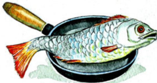
Рис. В. Якуновой

Мы отведали леща — Знаем правило «Ча-Ща».