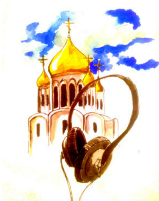
Рис. Д. Соболевского