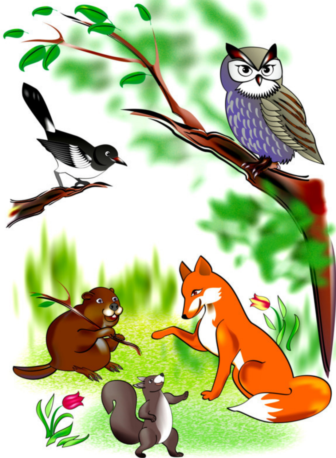
Рис. Н. Гаркуши

Будь внимательным! Смотри: Буквы безударные Очень своенравные: Хитрые, коварные.