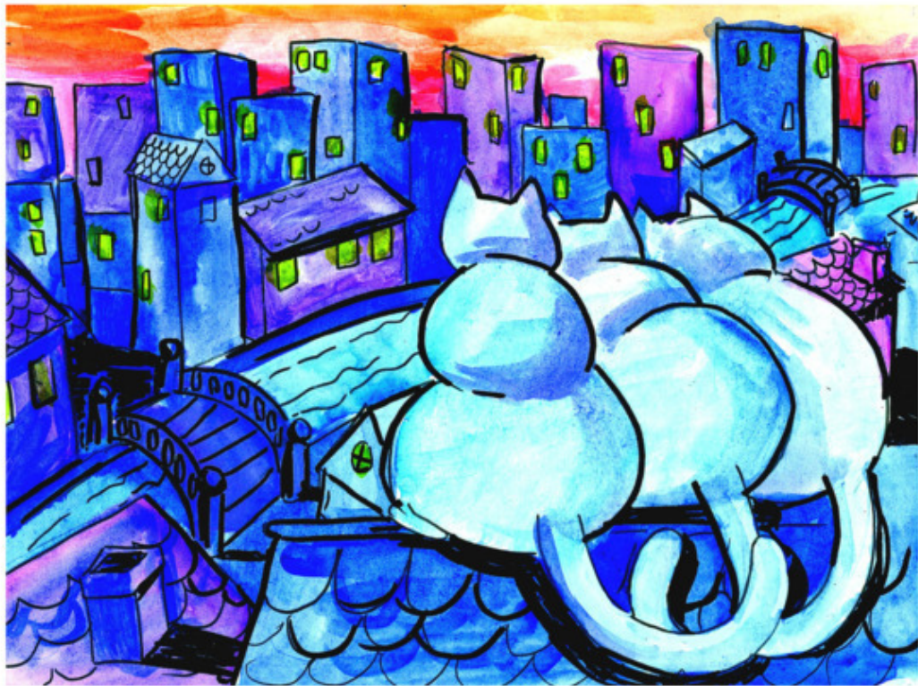
Рис. Д. Есечкиной

Бескозырка и бушлат 19 — Встрече с мóрем очень рад!