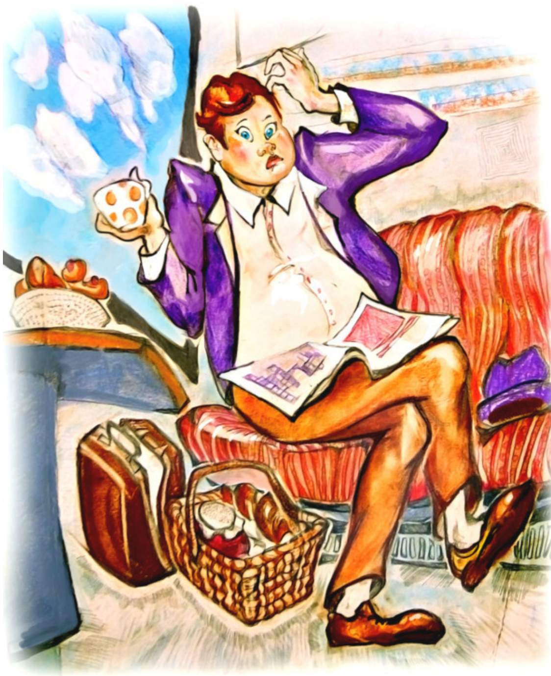
Рис. Д. Серебряной

И завинчен крышкой соус, Сочный персик, две ватрушки, Сдобные печенья, сушки.