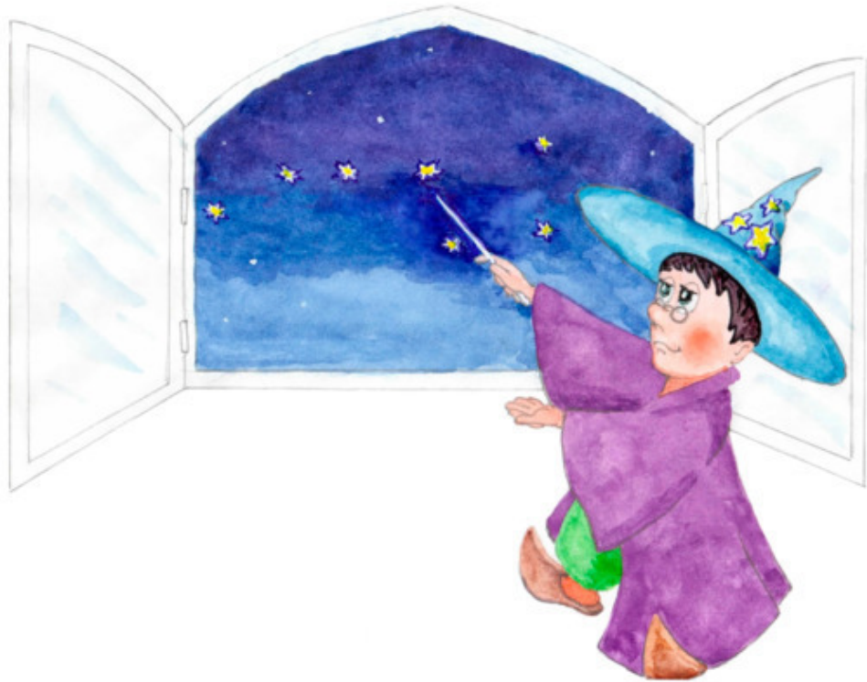
Рис. Е. Рехтиной

Как всегда неторопливый , Основательный, учтивый, Неленивый , нехвастливый , Звёздочкам ведёт учёт.