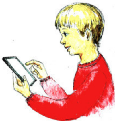
Рис. В. Якуновой

Был он радостный, весёлый , На рыбалку шёл смеясь. Возвращался невесёлый : Обманул его карась! Недовольный, несерьёзный, Незатейливый, незлой, Неумелый и несмелый, Нетактичный, непростой. Стал разумный неразумным (Он про книги позабыл). А неумный – очень умным (Папа ридер 20 подарил). Кит большой – кот небольшой , Як живой – плуг неживой . Выездной – невыездной. Невнимательный, нечестный, Нестарательный, нелестный, Несъедобный, неизвестный.