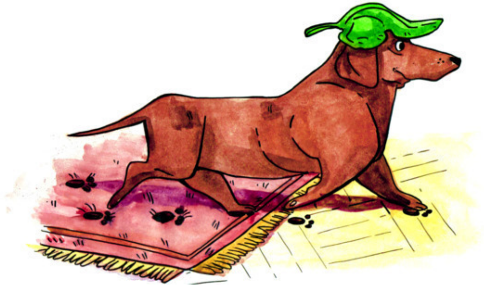
Рис. Д. Есечкиной

Мама счастьем называет Наш уютный тёплый дом, Неужели не прощает? Мы отчаялись вдвоём. «Чапа кошку догоняла, В чашу кошка убежала...»