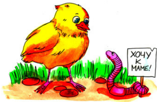
Рис. Д. Есечкиной