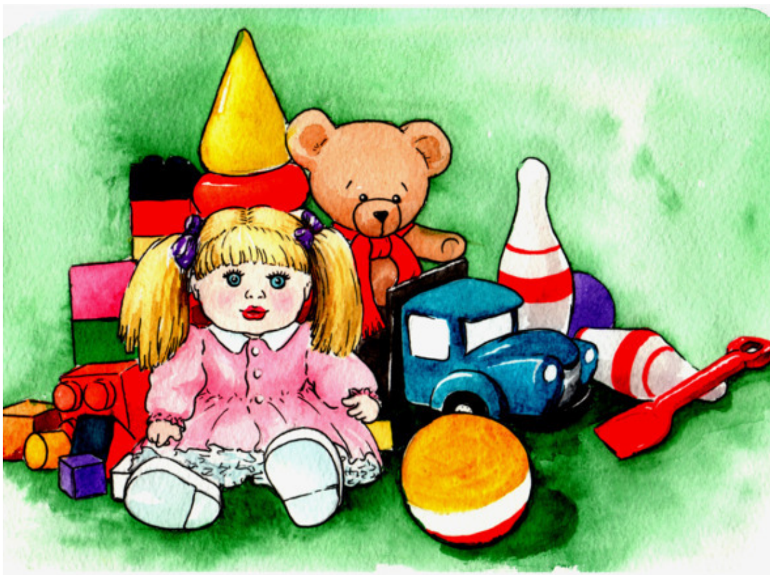
Рис. А. Красильниковой