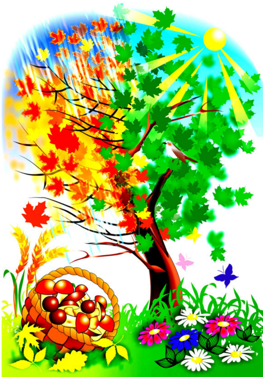
Рис. Н. Гаркуши

(С работой этой справится любой), Лі́ст и но́рка, бо́р и до́м. Новых мы заданий ждём!