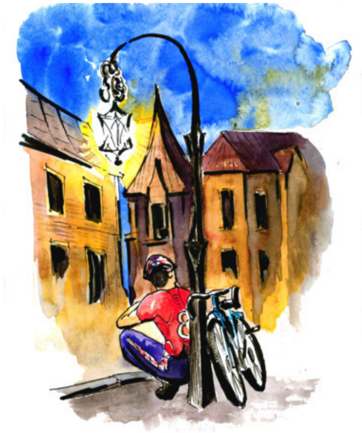
Рис. Д. Соболевского

Бакенщик 5 работал на реке, Проплывал кораблик вдалеке. Велогонщик гонку завершил, У него совсем не стало сил. Керосинщик 6 нынче не у дел: