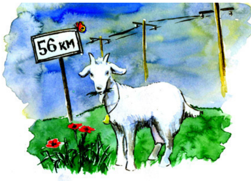
Рис. Д. Соболевского

Километры до избы Стóлбик обозначит. Стóлбик в винограднике — Подрастай, лоза! И подскажут «кóзы», Как писать «кoза».