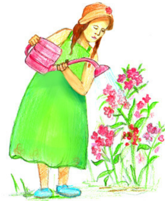
Рис. Д. Ушаковой

Эти шутки несмешные , Анекдот вполне смешной . Вот духи недорогие , Сам подарок — дорогой . Мне причины неясны: Не цветные снятся сны. Я цветные посадила Флоксы в первый день весны.