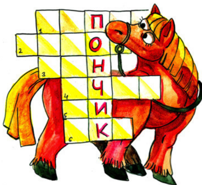
Рис. Д. Есечкиной