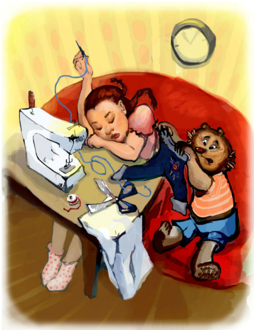
Рис. Д. Серебряной

Почему нигде не учат Мишек мысли выражать?