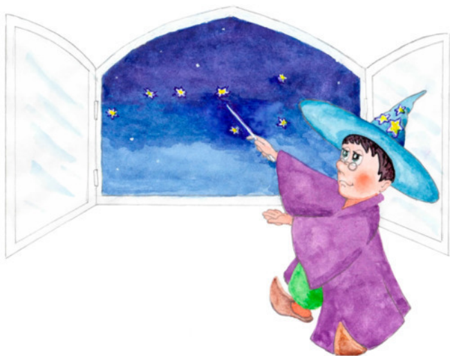
Рис. Е. Рехтиной

Ручеёк бежит, течёт. У окошка Звездочёт. Как всегда неторопливый , Основательный, учтивый, Неленивый , нехвастливый , Звёздочкам ведёт учёт.