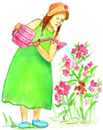
Рис. Д. Ушаковой

У высокого у клёна Рядом с рощицей зелёной Невысокий дом стоит. Топят печь, и дым валит. Непрозрачный дым всегда, А прозрачная – вода, Что Москва-река, что Истра.