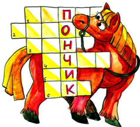
Рис. Д. Есечкиной