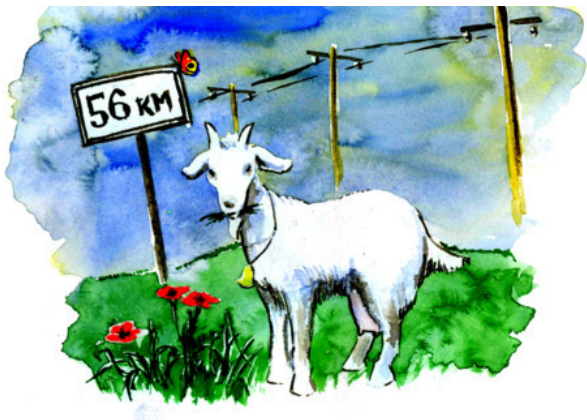
Рис. Д. Соболевского

Километры до избы Стóлбик обозначит. Стóлбик в винограднике — Подрастай, лоза! И подскажут « кóзы », Как писать « коза ».