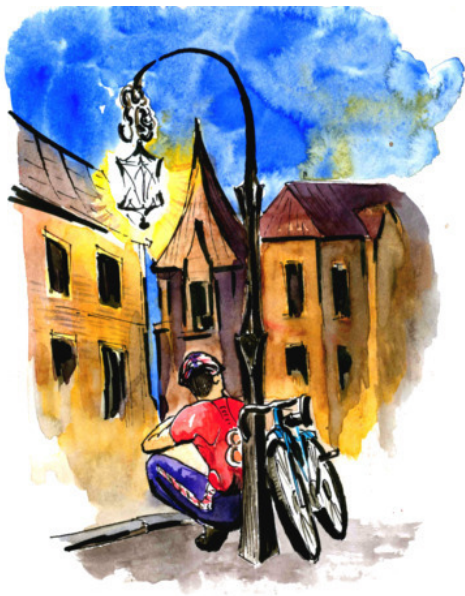
Рис. Д. Соболевского

Ручеёк клиентов оскудел. И повсюду светят, посмотри, Электрические фонари. А жестя н щик 7 в автомастерской Выправляет вмятину. – Постой,