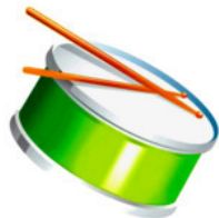
Рис. Н. Гаркуши

Строит каменщик высокий дом, А бетонщик замесил бетон. «До чего алмазы хороши!» — Говорит огранищик от души. Эскимо мороженщик продаст,