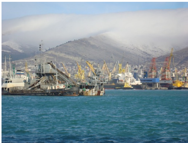
Новороссийск – бухта.