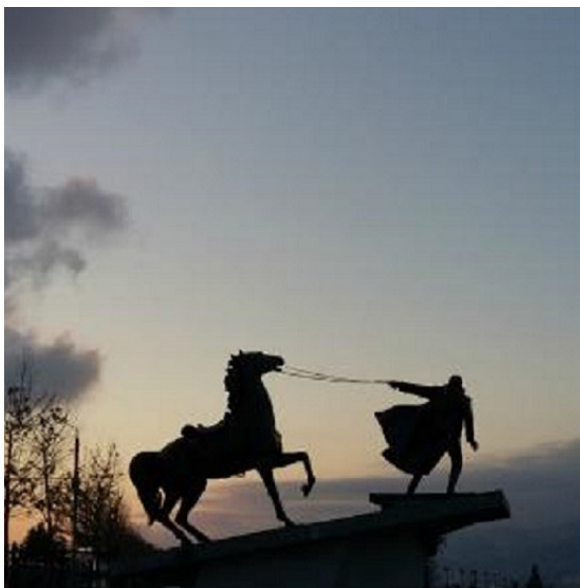
Памятник эвакуации белых войск, из Новороссийска.