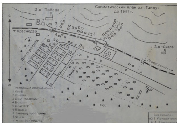
Карта п. Гайдук 1941 г.