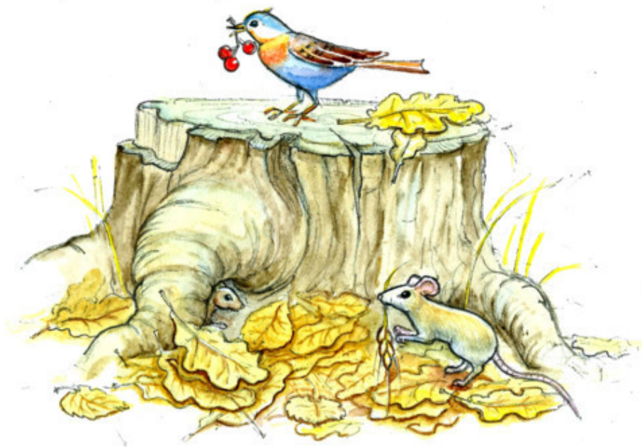
Рис. Валерии Якуповой

Осень с лукошком, С дождём, с урожаем, Яблоки соком полны. И с перелётною птичьей стаей Вновь прощаемся мы.