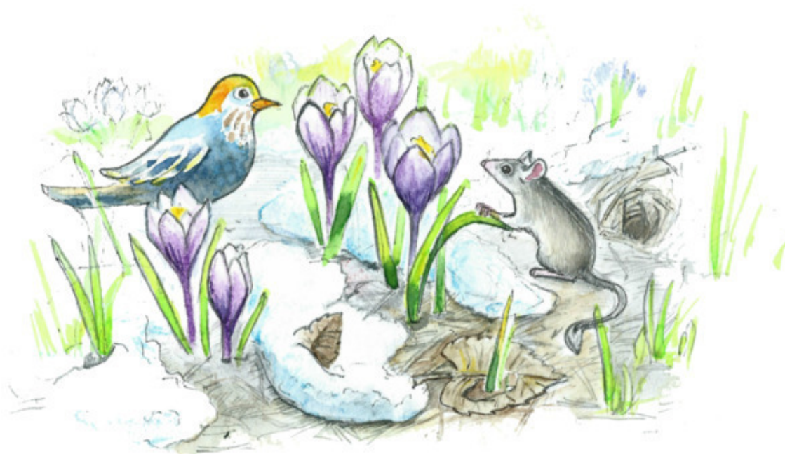
Рис. Валерии Якуповой

Снова ручьи Побегут по пригоркам С песней во славу весне. Звери покинут тесные норки, Белка мелькнёт на сосне.