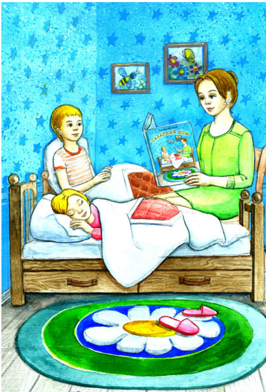
Рис. Валерии Якуновой