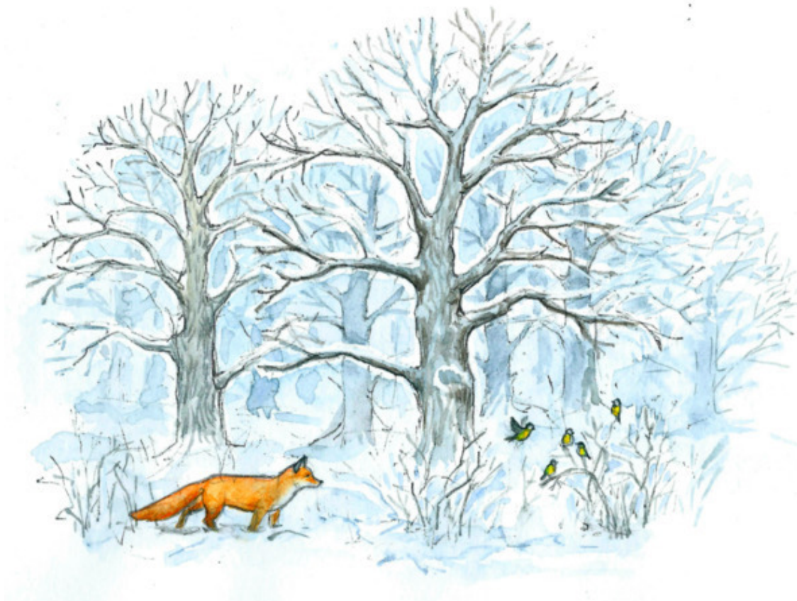
Рис. Валерии Якуповой

Снег на деревьях Лежит кружевами, Тонко сосульки звенят. Синяя дымка над полем растает, Солнца почувствовав взгляд. А снегири и клесты, Свиристели Песню споют на заре, И затаятся на время метели В выстуженном январе.