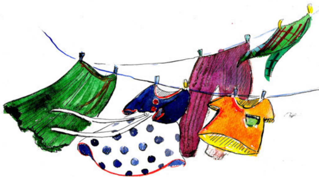
Рис. Алины Мозалевой

До чего же я устала — Полчаса бельё стирала. Ждут раздетые игрушки Окончанья «постирушки»: Кукла Женя и котёнок, Черепашка и зайчонок.