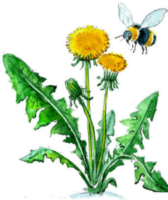
Рис. Валерии Якуновой

Лебедь на озере кипенно-белый Так грациозно плывёт. Гром за рекою — Такой неумелый, Он не грохочет – поёт. Шмель, пролетая, Жужжит и кружится, Что-то цветку говорит. В небе высоком вольная птица В тёплых потоках парит.