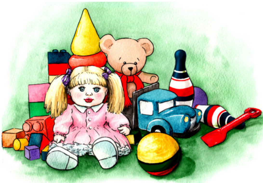
Рис. Аурики Красильниковой