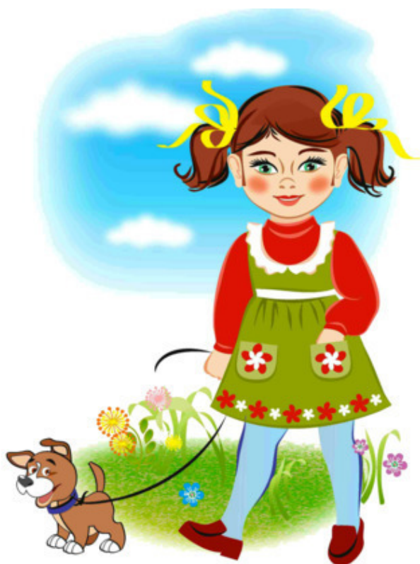
Рис. Натальи Гаркуши

А встречный Бобик нам пролает: «Привет!» (Мол, он соседей знает). На языке своем собачьем Он пожелать спешит удачи, Добавив фразу, как награду: «Хозяйка у тебя что надо!»