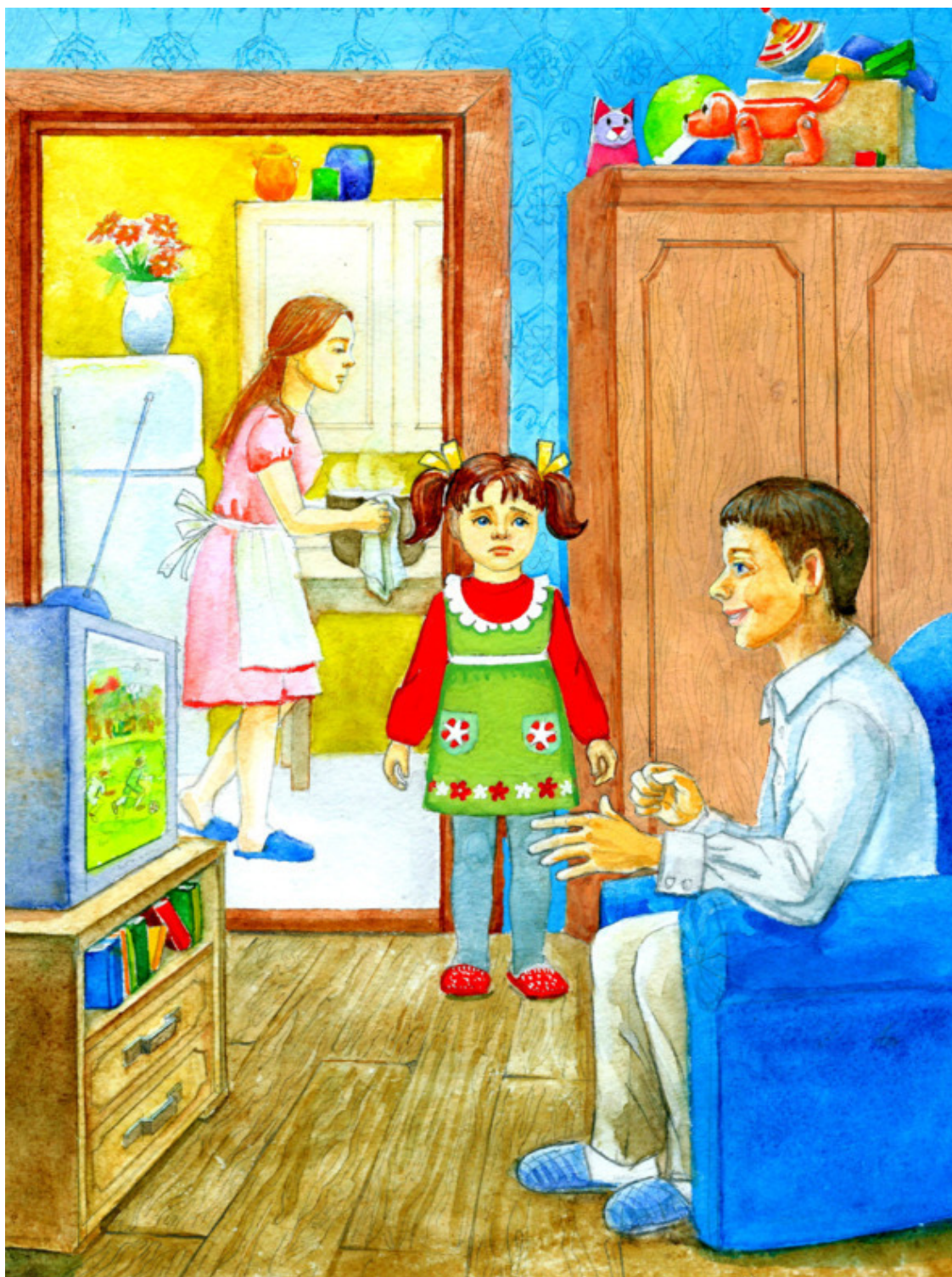
Рис. Валерии Якуновой

Часами буду с ним возиться, И убирать, и не лениться.