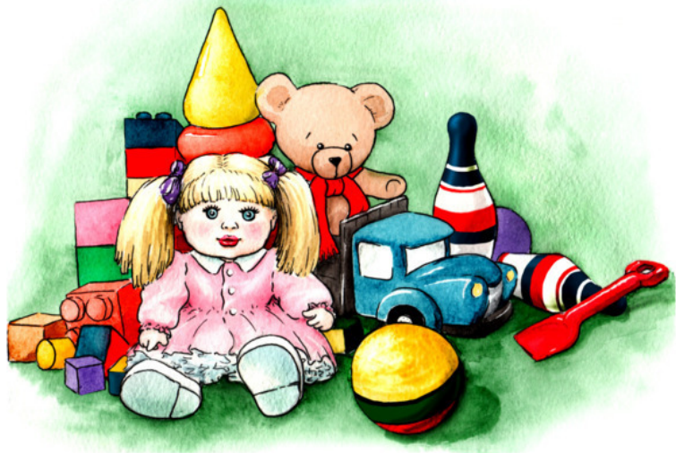
Рис. Аурики Красильниковой