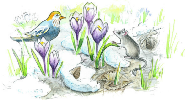
Рис. Валерии Якуновой

Снова ручьи Побегут по пригоркам С песней во славу весне. Звери покинут тесные норки, Белка мелькнёт на сосне.