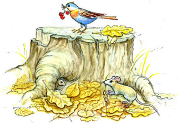
Рис. Валерии Якуновой

Осень с лукошком, С дождём, с урожаем, Яблоки соком полны. И с перелётною птичьей стаей Вновь прощаемся мы.