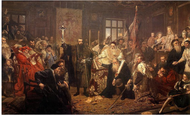
Фото из источника в списке литературы [6].

На территории Великого княжества Литовского (ВКЛ) численность евреев в 1560-е годы была равной двадцати тысячам человек. К периоду 1628-го года она уже составляла сорок тысяч. Согласно данным историка Беларуси З. Ю. Копысского, в белорусских местечках и городах доля евреев варьировала в диапазоне от двух до десяти процентов от всего населения.