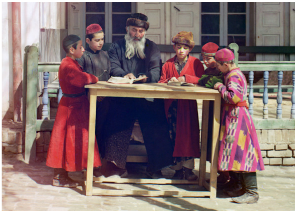
Фото из источника в списке литературы [7].