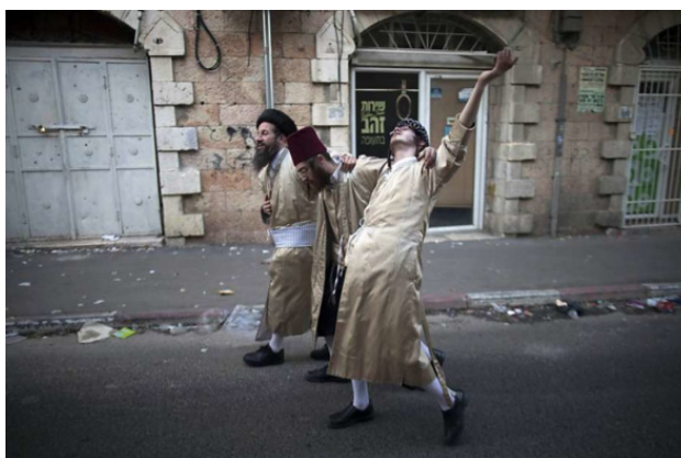
Фото из источника в списке литературы [5].