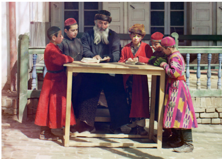
Фото из источника в списке литературы [7].

Упадок Еврейского образования и учебные заведения