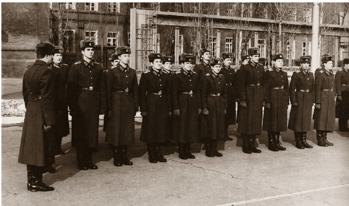
Строевой смотр в зимней форме одежды