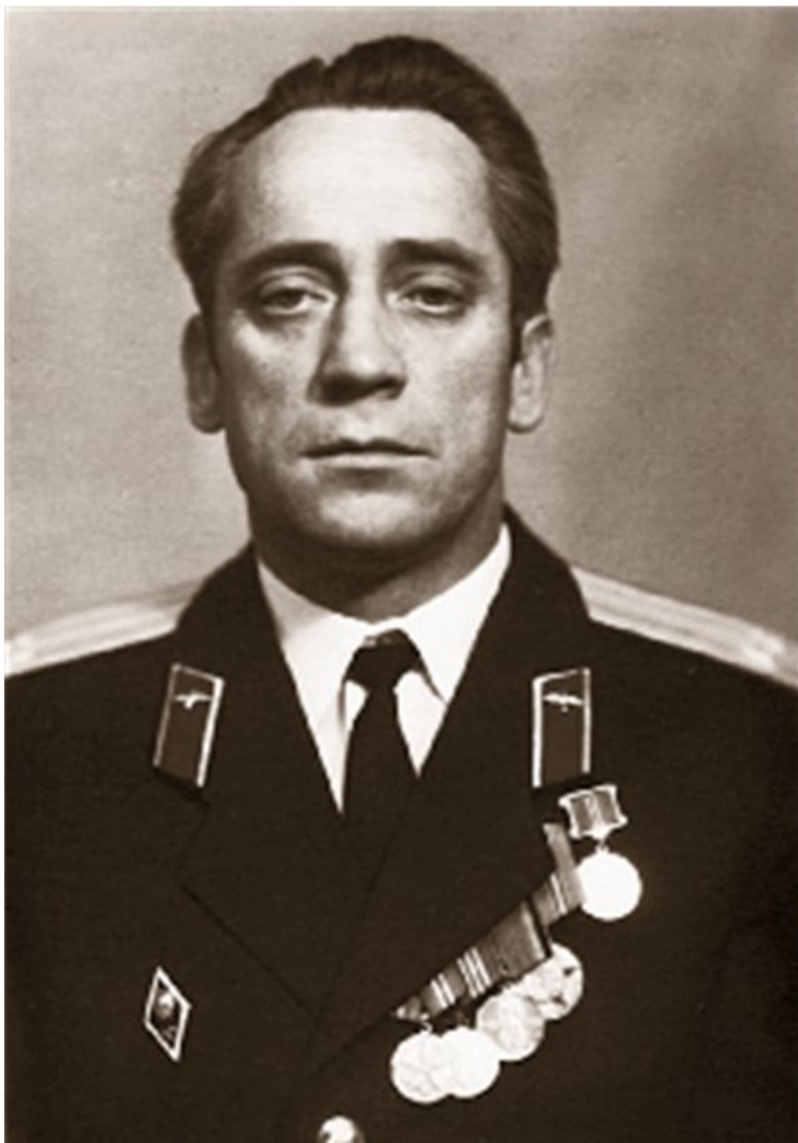
Подполковник Александр Павлович Канин