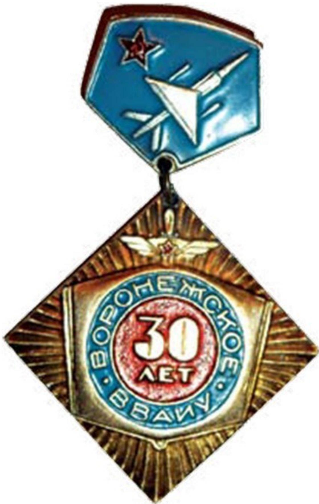
Памятный знак в честь 30-летия Воронежского ВВАИУ