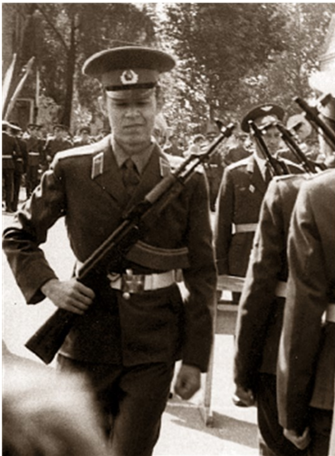
9 сентября 1979 г. Моя присяга. Недоволен своей строевой выучкой