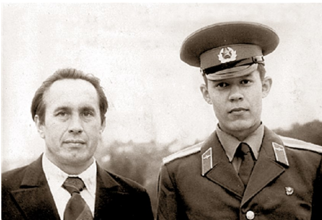
С отцом после присяги