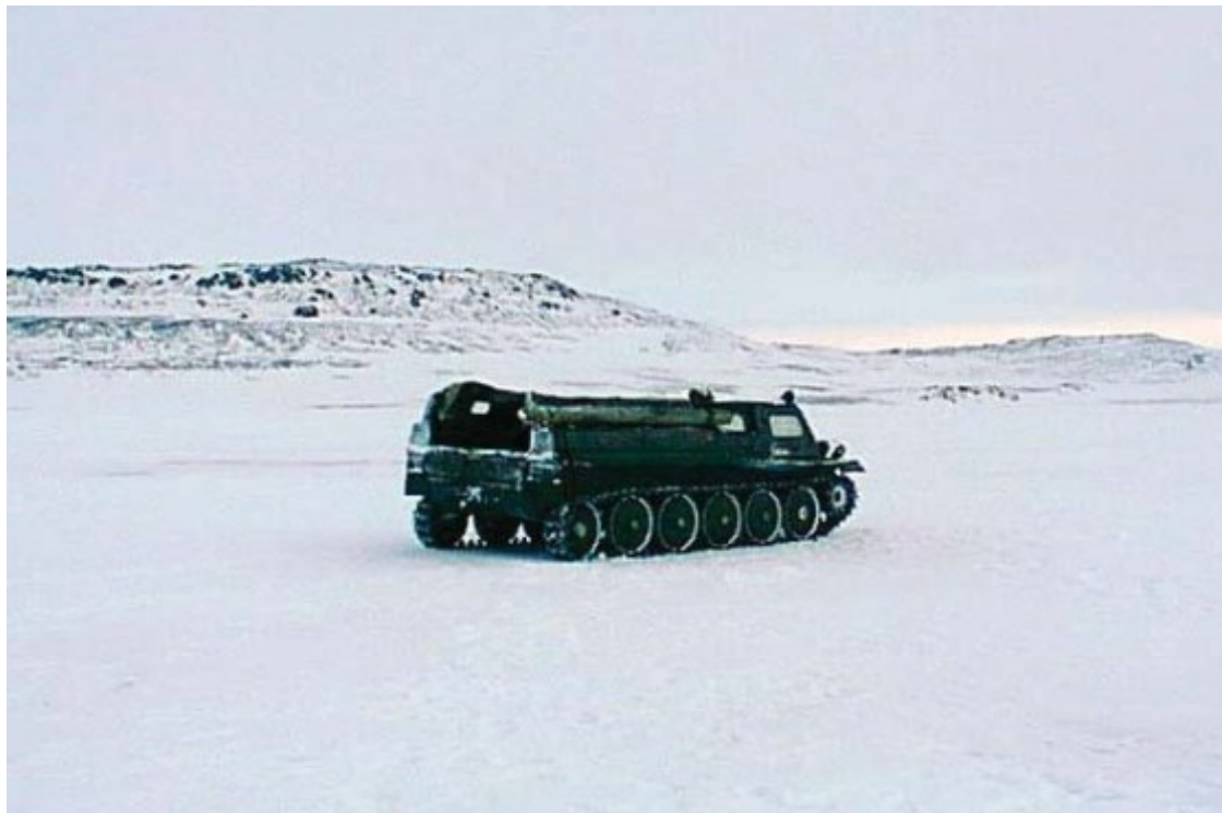
ГТС в ледяной пустыне