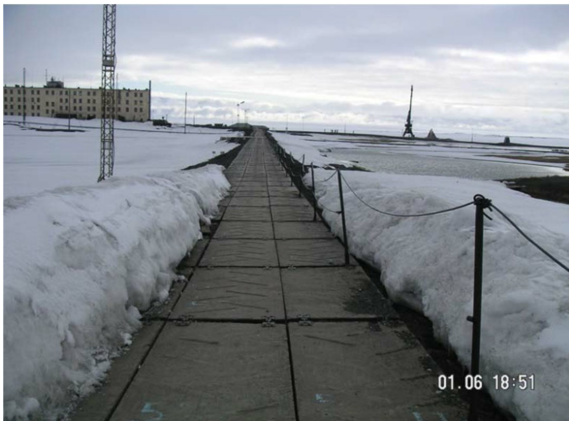
Дорога к штабу полигона и крану