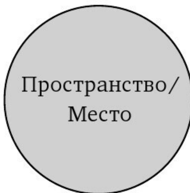
Ил. 2.5. Пространство и место тождественны

Читатель может руководствоваться этими теоретическими схемами взаимоотношений между пространством и местом, пробираясь через порой водящие кругами дальнейшие рассуждения. Данные диаграммы являются визуальными шаблонами для продолжающихся дискуссий и отправными точками для различных дисциплинарных траекторий и теоретических ориентаций. В заключительной части этой главы мы к ним вернемся, чтобы установить определения пространства/места и отношения между ними, которые будут использоваться в последующем тексте.