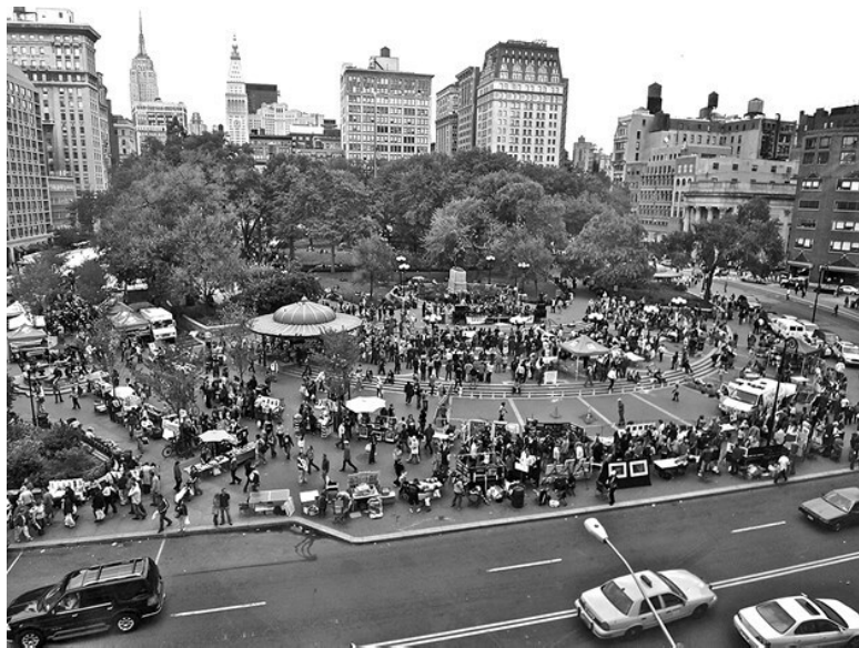
Ил. 1.1. Юнион-сквер (Грегори Т. Донован)