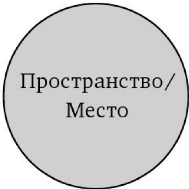
Ил. 2.5. Пространство и место тождественны

Читатель может руководствоваться этими теоретическими схемами взаимоотношений между пространством и местом, пробираясь через порой водящие кругами дальнейшие рассуждения. Данные диаграммы являются визуальными шаблонами для продолжающихся дискуссий и отправными точками для различных дисциплинарных траекторий и теоретических ориентаций. В заключительной части этой