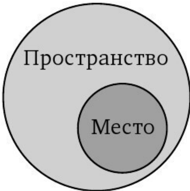
Ил. 2.3. Место внутри пространства