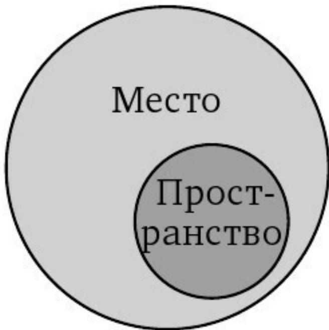
Ил. 2.4. Пространство внутри места