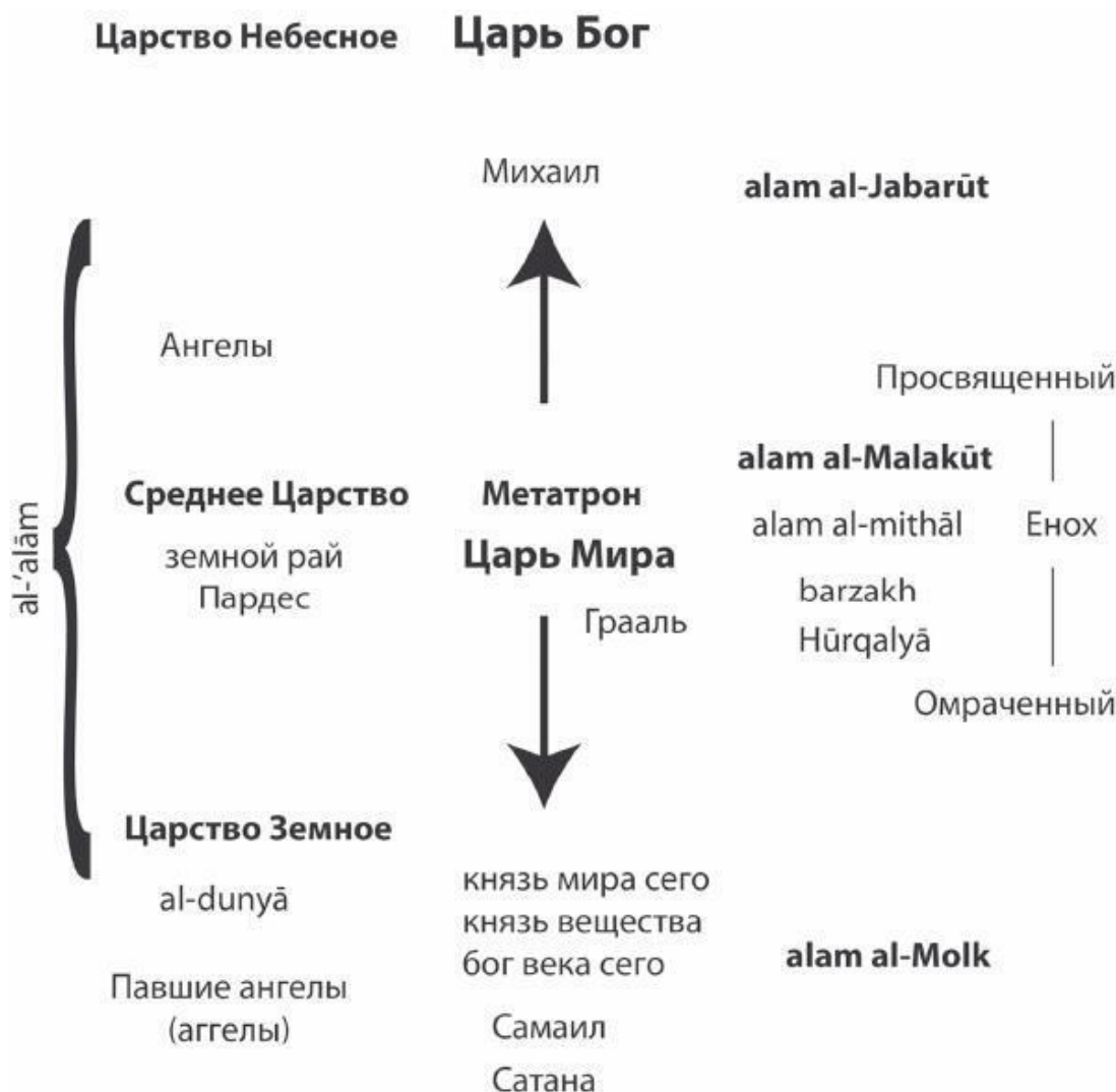
Схема Трех Царств

Именно средний мир, то есть третье, промежуточное царство между небесным и земным, и определяется как Царство по преимуществу . Выше него находится Небо (или мир могуще-