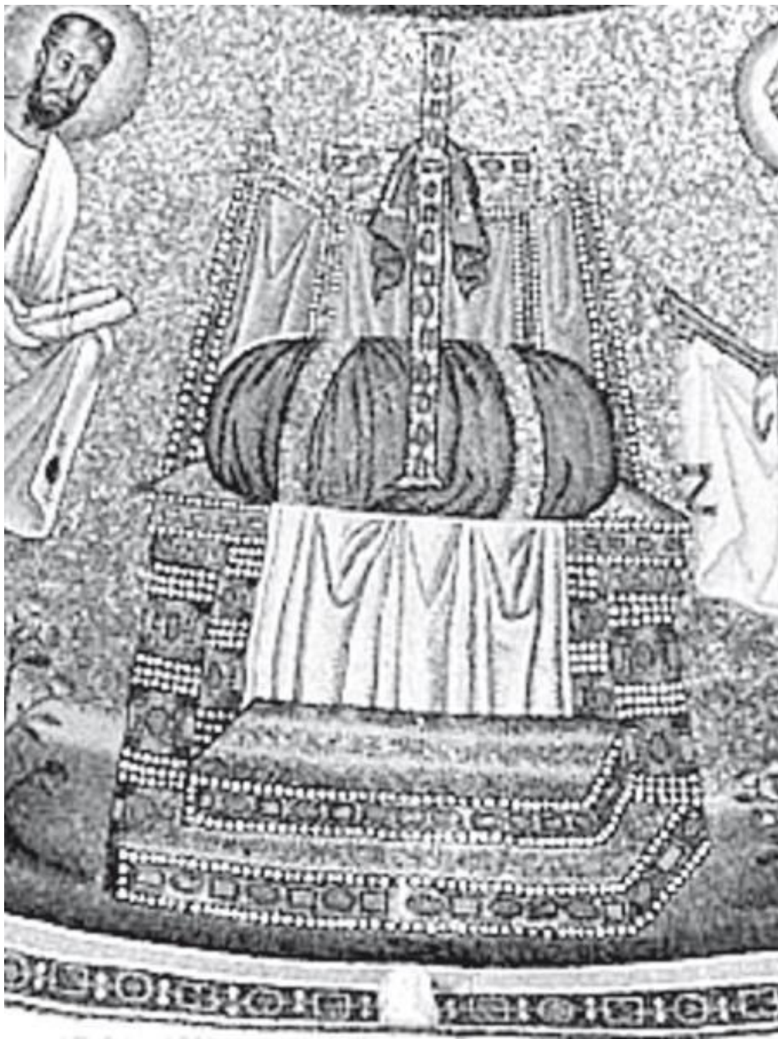
Арианский баптистерий в Ровенне. Этимасия (престол уготованный)

Этимасия также представляет собой двойную онтологию – пустой не пустой трон , и в полном соответствии с метафизикой Царя Мира соотносится с удалением и возвращением истинного и легитимного Правителя.