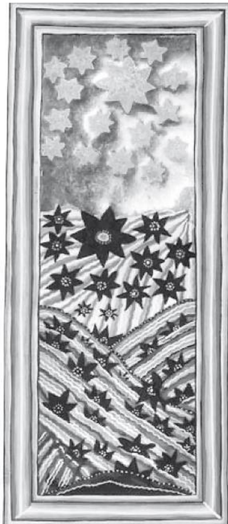
«Падение Люцифера преобразается в славу человечества». Рисунок из книги Хильдегарды Бингенской Wisse die Wege Scivias