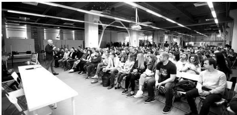
Встреча «Клуба короткометражного кино» в Московской

потому что, отдавая свои знания, получаешь еще больше! И в том же 2014 году я стал куратором курса «Фильммейкинг» Московской Школы Кино. В 2014–2017 годы на нем обучались 275 студентов, которые за это время сняли 74 короткометражных фильма – и сделали это в бюджетных рамках 20–150 тысяч рублей вполне профессионально, ничуть не уступая короткометражным фильмам классических киновузов с бюджетами в районе миллиона рублей, и достойно конкурируя с ними на различных показах и кинофестивалях. Некоторые из них не только поучаствовали в отечественных фестивалях, таких как «Святая Анна», «Короче» и «Кинопроба», но и побывали на международных кинофестивалях в США, Франции, Великобритании, Германии, Италии и Афганистане.