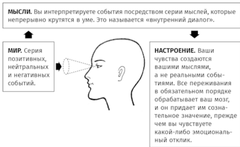
Рис. 3.1. Отношения между событиями окружающего мира и тем, как вы себя чувствуете. Не реальные события, а именно ваше восприятие приводит к изменениям настроения. Когда вы грустите, ваши мысли будут казаться реалистичной интерпретацией негативных событий. Когда вы в депрессии или встревожены, мысли всегда будут нелогичными, искаженными, нереалистичными или просто ошибочными

умственных искажений. Ваше дурное настроение можно сравнить с помехами, возникшими от того, что радио плохо настроено на частоту. Проблема не в том, что лампы или транзисторы перегорели или неисправны или что сигнал радиостанции искажается из-за плохой погоды, – просто нужно настроить частоту. Когда вы научитесь выполнять эту ментальную настройку, музыка снова станет четкой и в вашем состоянии наступят улучшения.