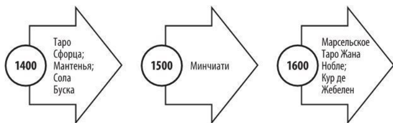
Рис. 1. Временная шкала Таро

Давайте вначале рассмотрим временную шкалу Таро (рис. 1), где отмечены ключевые моменты истории картомании: труды и личности, связанные с Таро, а также различные колоды. Можно сказать, что Таро, если говорить об истории в целом, появились относительно недавно. Они совсем молоды по сравнению с другими гадательными системами (например, с китайской Книгой Перемен «И-Цзин»).