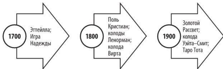
Рис. 1. Временная шкала Таро (продолжение)

Однако, перед тем как отправиться в глубь веков, мы познакомимся с современным значением карт Таро и научимся раскладывать нашу колоду современным способом. В последней главе, посвященной Тарософии, мы еще раз вернемся к данной теме и рассмотрим самые передовые методы расклада.