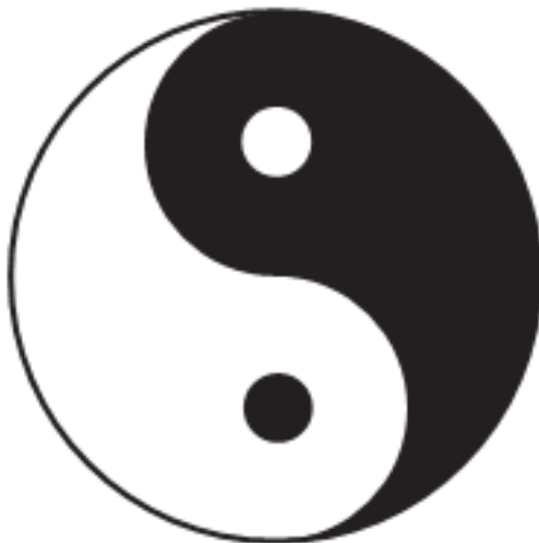
Рис. 2. Символ реинкарнации

Черный кружок на белом фоне – это то знание, что было нами получено в материальном мире, и которое необходимо нам для духовного роста в период вознесения души. Волнистая линия, разделяющая обе половины, может символизировать непрерывающееся движение, переход от одной жизни к другой – от телесного к духовному и от духовного – к телесному.