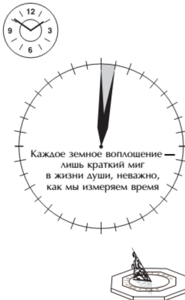
Рис. 3. Время

Цель наших реинкарнаций – возвысить характер наших личностей, усовершенствовать их, научиться в полную силу пользоваться энергией души. Благодаря этому мы становимся хозяевами своего процесса развития и участвуем в творении мира посредством сил любви и воли.