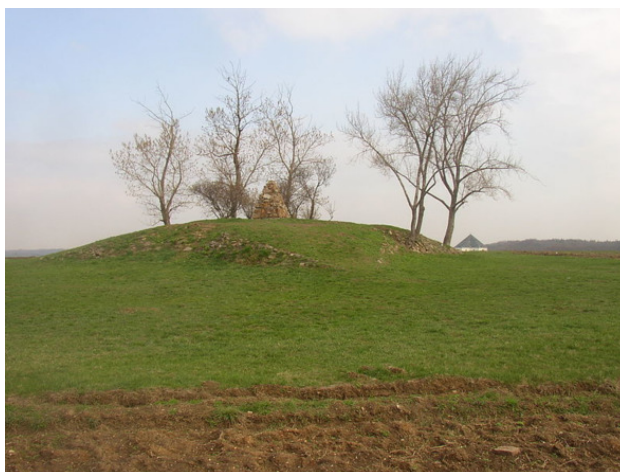
Белая гора в наши дни

С военной точки зрения еще не все было потеряно. За стенами Праги укрылась солидная армия. Ключевые крепости страны находились в руках протестантов, располагавших серьезными резервами. Но антигабсбургский лагерь опять подвело то, что в нем не было единства. Чехия капитулировала. И не просто капитулировала – на триста лет она потеряла независимость. 16 июня 1621 года на Староместской площади были казнены 27 предводителей восстания, попавших в руки католических военачальников. Сейчас это место отмечено 27 белыми крестами. Как пишет в «Старинных чешских сказаниях» Алоис Ирасек, который уже упоминался (и еще будет упоминаться) в этой книге, «рассказывают, что будто бы казненные дворяне и горожане один раз в году, в ночь накануне дня казни, сходятся на этом печальном месте. Идут они во главе с самым старшим, почти девяностолетним паном Карлиржем из Силевиц, за ним следуют пан Будовец из Будова, высокий и седобородый, старый пан Конецхлумский, Кохан из Прахова, пан Криштоф Гарант, Дивиш Чернин – пан из Михаловиц, Шлик, Ото из Лосу, пан из Биле, Гоштялек, Есенский, Воднянский, Вокач, Иржи Ржечиский, Кобр, Избицкий и другие, старые и молодые, а самый младший из них – сорокалетний Ян Кутнаур, что едва стоял на ногах, но держался гордо и умер с песней на устах. Соберутся они на месте казни, а потом тихо и безмолвно пройдут по площади до Тынского собора. Там они преклонят колени перед алтарем, причастятся по старинному обычаю и исчезнут без следа».