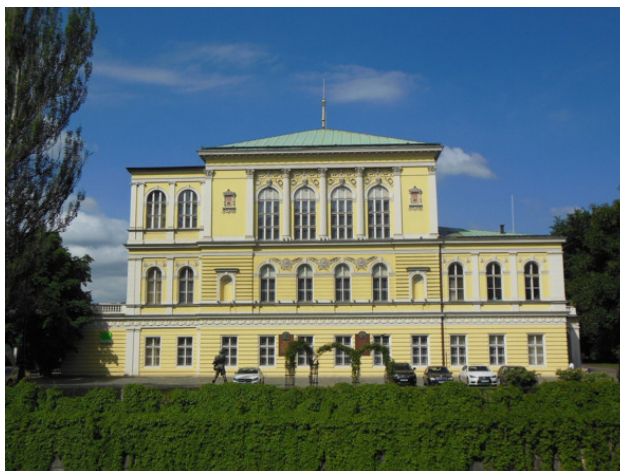
Софийский дворец на Славянском острове

В 1848 году в Праге состоялся Славянский конгресс. Он прошел в неоренессансном Софийском дворце, находящемся на Славянском острове. Оказалось, что многие пражане ожидали от делегатов конгресса более радикальной позиции, и в городе начались волнения, а 11 июня случайная пуля убила княгиню Виндишгрец, жену австрийского фельдмаршала Альфреда Виндишгреца. Тот в ярости направил в Прагу войска. Солдаты открыли огонь по демонстрантам, горожане принялись строить баррикады. Фельдмаршал объявил в городе осадное положение и подтянул артиллерию. После бомбардировки восстание было подавлено. Завершить конгресс и принять какое-нибудь итоговое решение о славянском единстве не удалось.