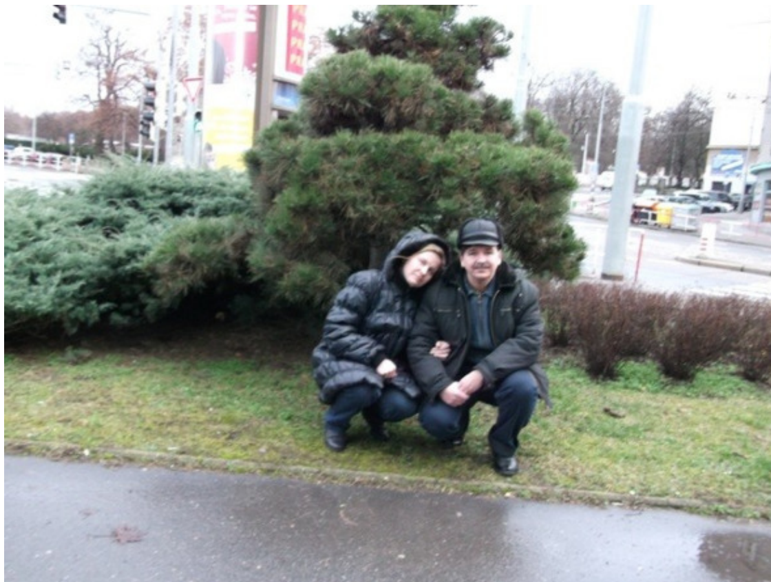
Мы с женой в зимней Праге

И заметьте – почти не пишу про пиво. Я его пью, но в небольших количествах: кружку-другую. И ни в коем случае не собираюсь строить из себя знатока. А ведь про пражские пивные можно сочинить многотомную эпопею.