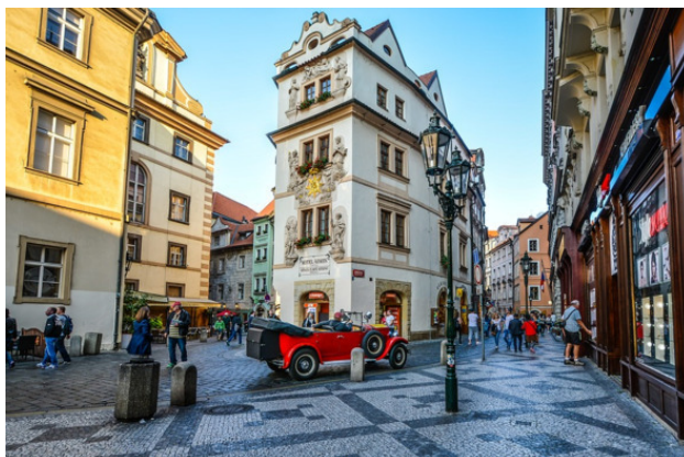
Прага. Просто Прага

В этой книге я хочу рассказать о Праге. О главных ее достопримечательностях, и о том, какими увидел их я – и во время поездок с семьей, и тогда, когда путешествовал в одиночку.