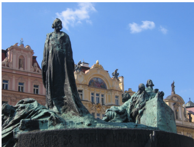
Памятник Яну Гусу на Староместской площади

Но костра хватило лишь на то, чтобы умертвить самого проповедника. Зато его учение продолжало жить. В 1915 году, через 500 лет после казни Яна Гуса, на Староместской площади воздвигли памятник в его честь. Так называемые чешские братья до сих пор сохраняют основы его учения, а в начале XX века церковь, отколовшаяся от чешских католиков, взяла себе имя гуситской.