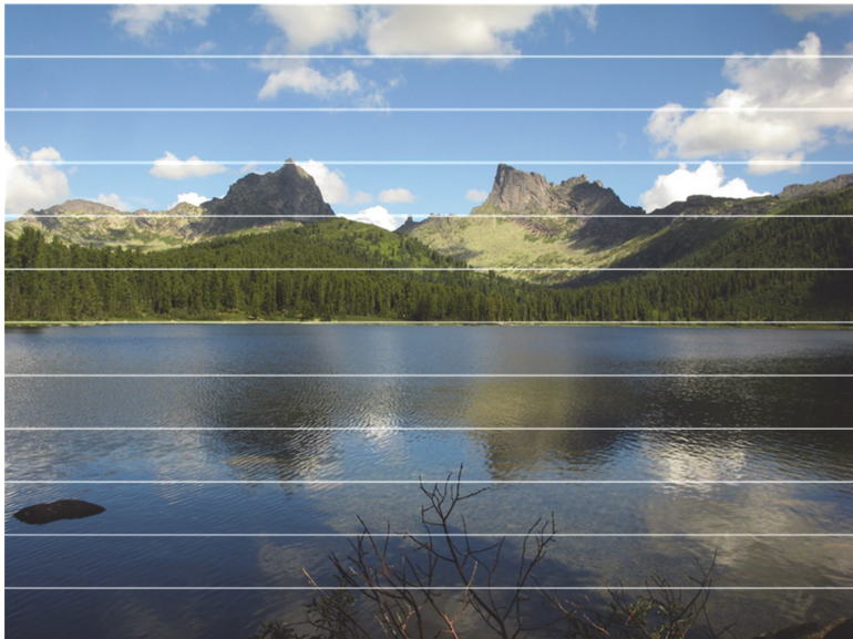
Рис. 2. Альпийский рельеф хребта Ергаки близ озера Светлого (Большого)

В геологическом плане система хребтов Западного Саяна представляет собой участки Джебашского и Куртушибинского антиклинориев (с расположенным между ними Западно-Саянским синклинорием), а все это сооружение с севера и юга ограничено Минусинской впадиной и Тувинским прогибом соответственно (Зоненшайн, 1961; Кляровский, 1973; Зятькова, 1988). Ядра антиклинориев сложены протерозойскими (по другим данным – кембрийскими (Лепезин, 1972;