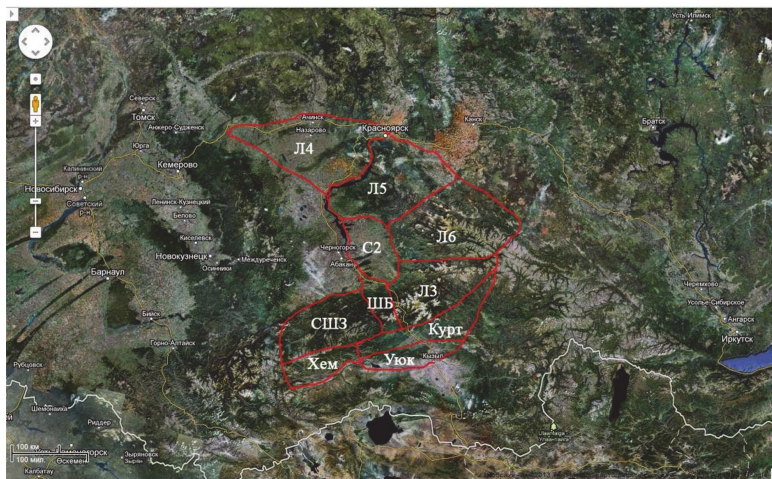
Рис. 4. Районирование территории Приенисейских Саян: Л4 – левобережная часть Восточного Саяна; Л5 – правобережная часть Восточного Саяна; Л6 – центральная часть Восточного Саяна; С2 – низкогорные части Саян, примыкающие к Минусинской котловине; ЛЗ – правобережная северо-восточная часть Западного Саяна; ШБ – правобережная

оны распределены по подпровинциям следующим образом: к Южной Алтайско-Саянской (Западно-Саянской) подпровинции относятся Хем, Уюк, Курт; к Северной Алтайско-Саянской (Западно-Саянской) подпровинции – СШЗ, ШБ, ЛЗ; к Восточно-Саянской подпровинции – Л6, Л5, частично Л4, частично С2; к подпровинции Минусинской котловины – частично Л4, частично С2.