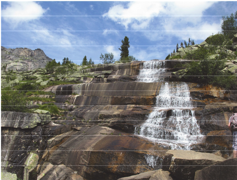
Рис. 3. Водопад в истоках р. Тушканчик в субальпийском поясе хребта Ергаки