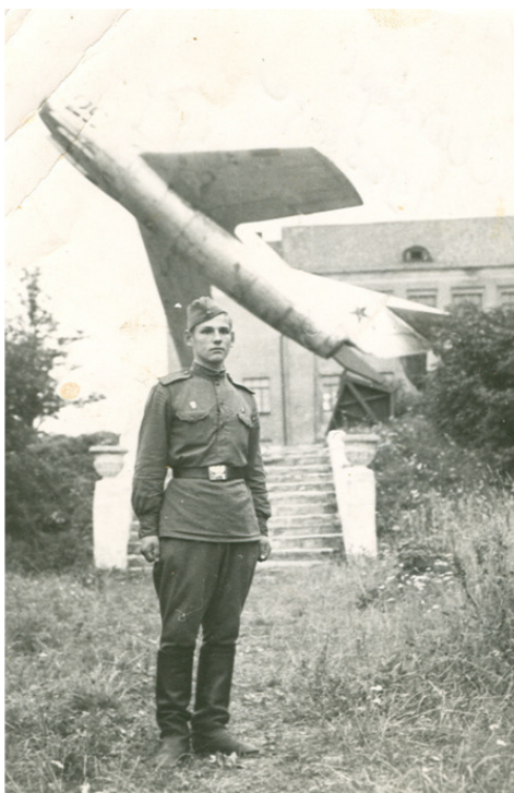
Калининград, 1968 год

Родные, близкие, друзья – мы все любим и помним этого доброго мечтателя.