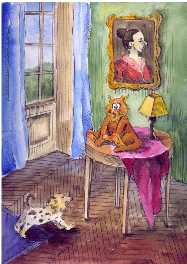
художник Даша Дубовик 14 лет