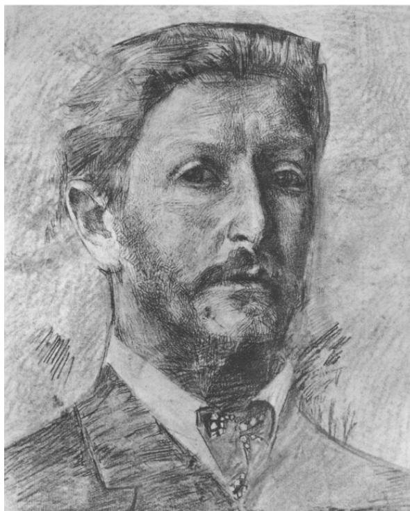
М. А. Врубель. Автопортрет. 1904 г.