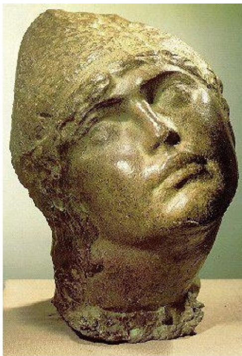
С. Д. Эрзя. Голова мордовки. 1917 г. Железобетон. МРММИ