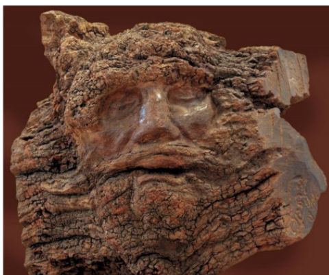
С. Д. Эрьзя. Портрет отца. 1944 г. Кебрачо. МРМИИ

Давным-давно в мордовской деревне Баеве, среди дремучих лесов, на берегу речки Бездны, жил один мальчик. Звали его Степан, Степашка, а фамилия у него была Нефедов. Он был маленький, худой, со светлыми волосами и приметливыми голубыми глазами. Характер у Степки был самостоятельный и молчаливый. Зимой большую часть времени он проводил на верху большой печки – на полатях. Там было жарко и душно. Еще бы – в избе жила не только его семья, но и весь их скот спасался там зимой от холода. Представь себе только – и корова, и свиньи, и гуси с курами – все вместе!