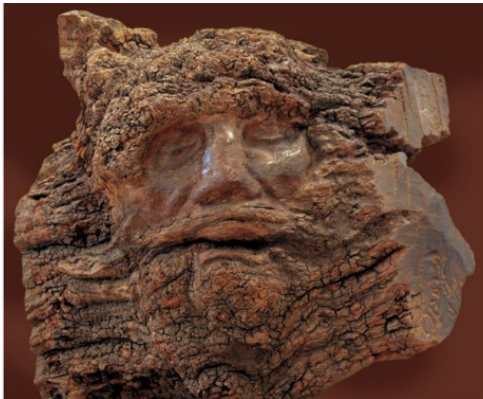
С. Д. Эрзя. Портрет отца. 1944 г. Кебрачо. МРМИИ