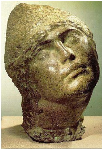
С. Д. Эрзя. Голова мордовки. 1917 г. Железобетон. МРМИИ