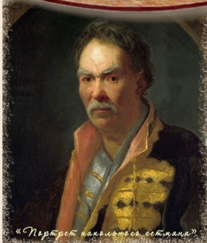
«Портрет павловского генерала»