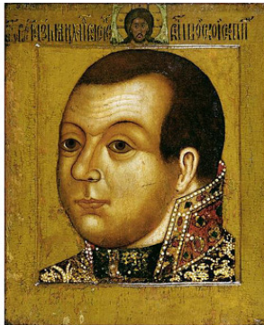
Князь М. В. Скопин-Шуйский. Парсуна. Начало 17 века. ГТГ

Сначала Ваня часто смотрел в зеркальце, но заботы и вопросы у него были не очень серьезные, и отражение то поднимало большой палец, то смешно скребло в затылке, а то и вообще язык показывало... И вот что интересно – зеркальце это всегда оказывалось в кармане тех штанов, которые были на Ване, и никто другой его ни разу не видел!