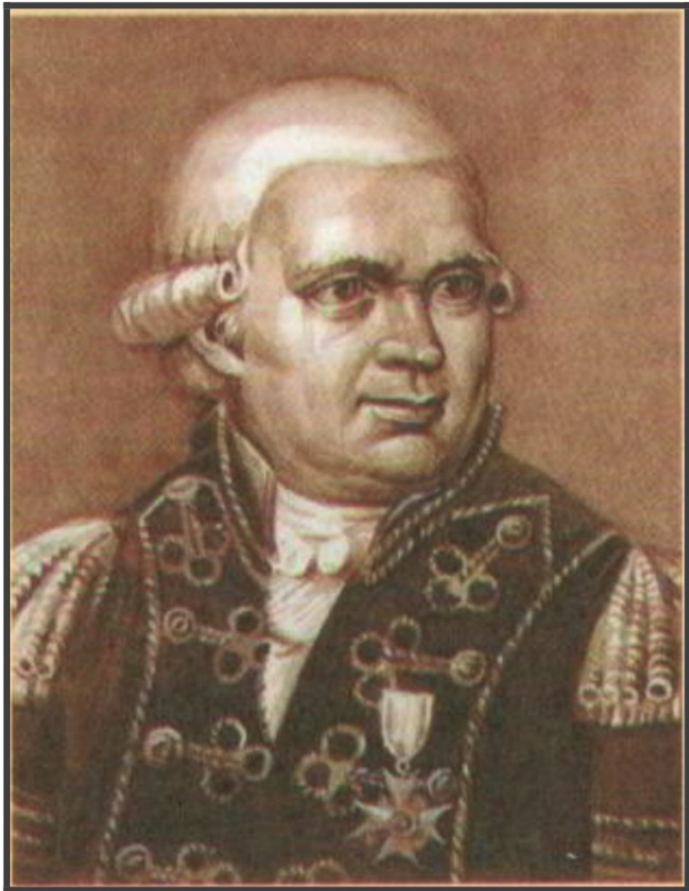
А. Г. Вернер (1750–1817)