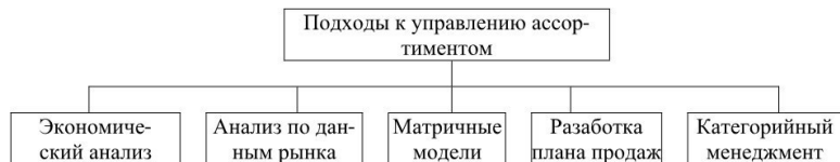
Рис. 1. Классификация методов управления ассортиментом

Существующая классификация методов управления ассортиментом схематично представлена на рис. 1.