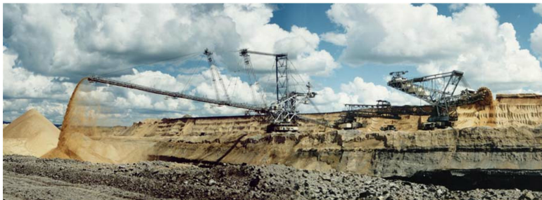
Рис. 1.3. Вскрышные работы комплексом непрерывного действия (разрез «Березовский»)