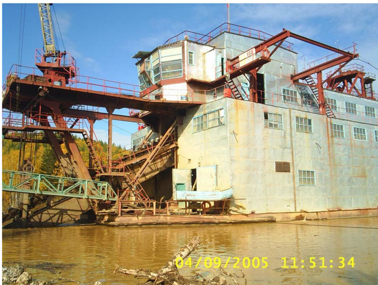
Рис. 1.5. Добыча золота дражным способом