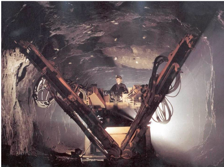
Рис. 1.8. Буровая установка