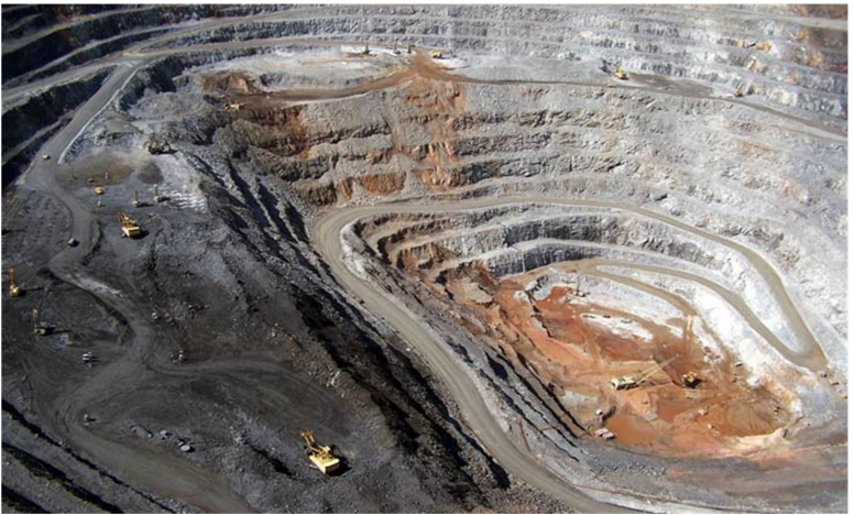
Рис. 1.1. Карьер «Восточный»

1.1–1.5) или подземным способом (рис. 1.6–1.8).