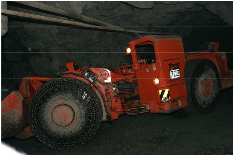
Рис. 1.6. Подземные работы (г. Норильск)