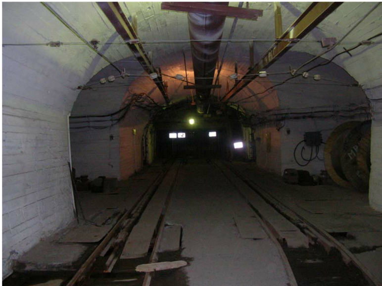
Рис. 1.7. Подземная выработка