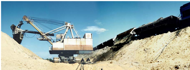
Рис. 1.4. Отвальные работы