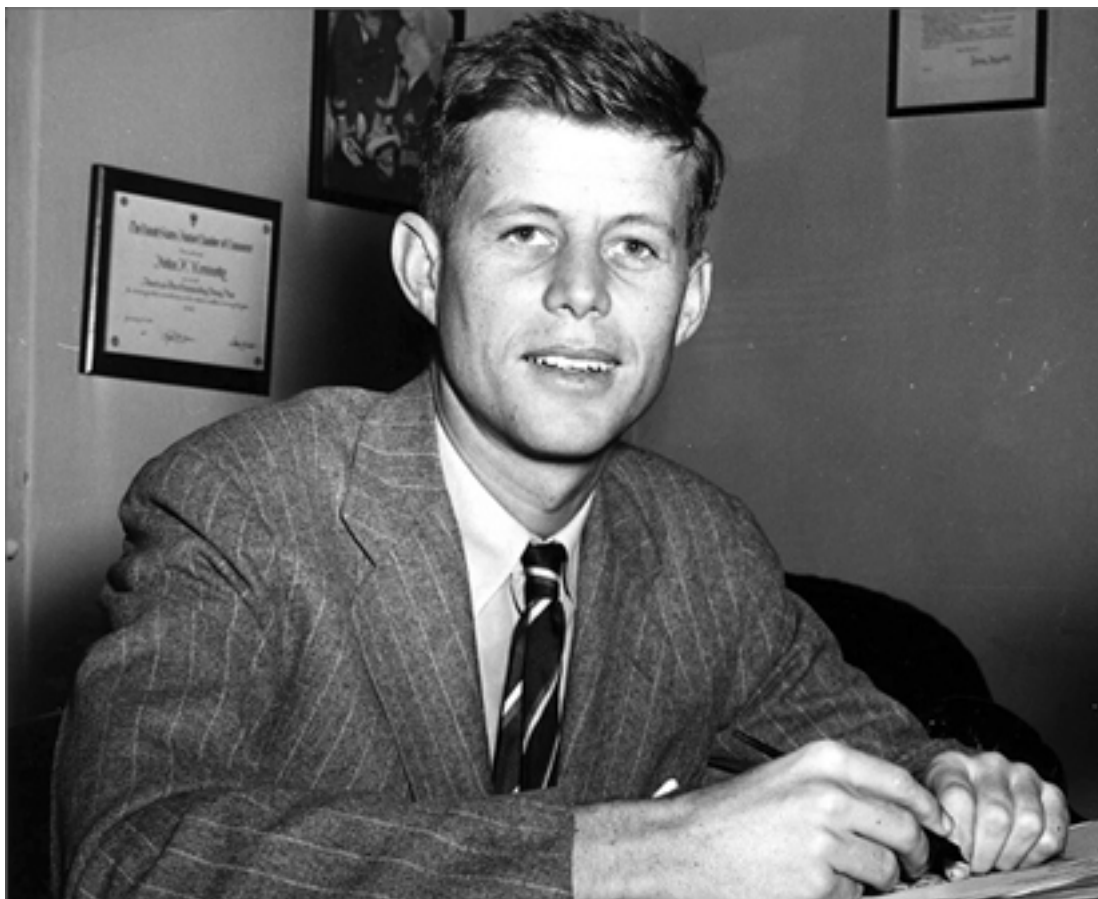
Конгрессмен Дж. Ф. Кеннеди. Вторая половина 1940-х гг.