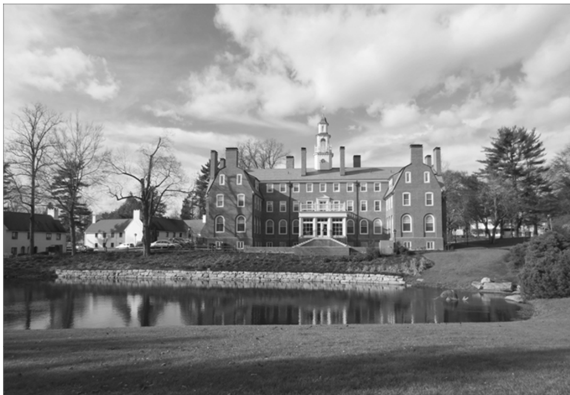
Чоут Розмари Холл

После возвращения из Лондона Джон Кеннеди короткое время (всего шесть недель) проучился в Принстоне. После этого у него обострилась болезнь Аддисона, и его пришлось госпитализировать. Потом, восстанавливаясь, Джек провел зиму 1935/36 года в доме семейства Кеннеди в Палм Бич, а весну и лето – на ранчо близ Бенсона, в Аризоне.