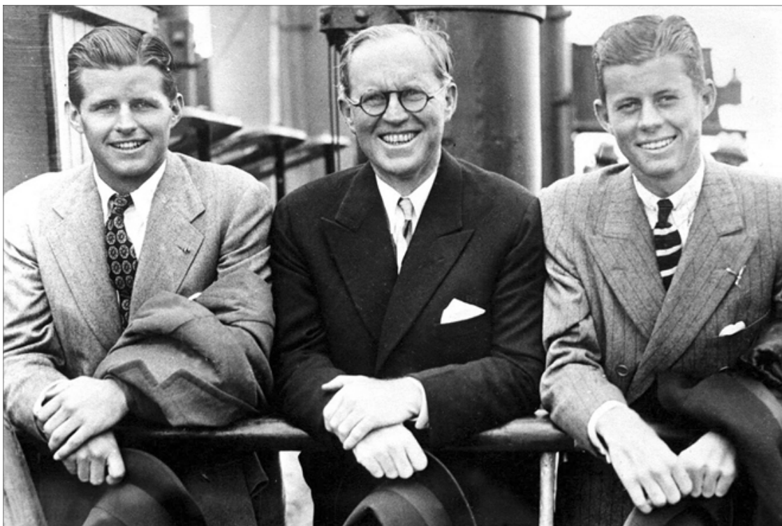
Джон Кеннеди (справа) со старшим братом (слева) и отцом в 1938 г.

По словам Джека, после смерти Джо «отец хотел, чтобы я пошел в политику... Впрочем, «хотел» – неправильное слово. Он не хотел, а требовал».