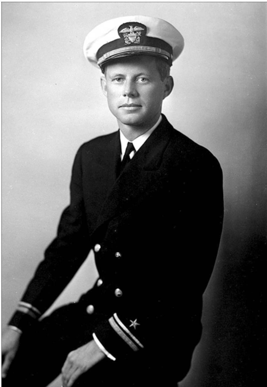
Джон Кеннеди в 1942 г.

В темную штормовую ночь 2 августа 1943 года в районе Соломоновых островов, у Новой Георгии, в проливе Фергюсона, японский эсминец «Амагири» протаранил торпедный катер PT-109, которым командовал лейтенант Джон Кеннеди. Это случилось в два часа ночи. Один из членов экипажа заметил неприятельский корабль за секунды до столкновения. Катер разломился пополам, и весь экипаж оказался в воде. При ударе последовал взрыв. Стоявший у