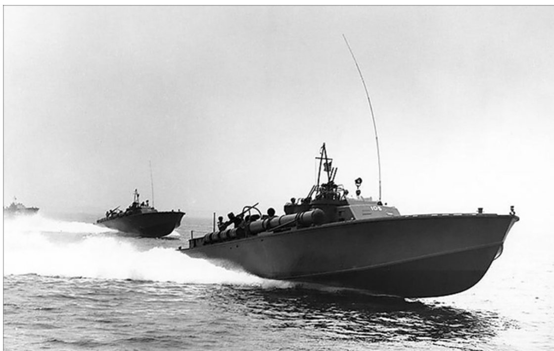
Американские торпедные катера

Когда Джона Кеннеди впоследствии спрашивали, как он стал героем, он отшучивался: «О, очень легко. Они разрезали мой катер пополам».