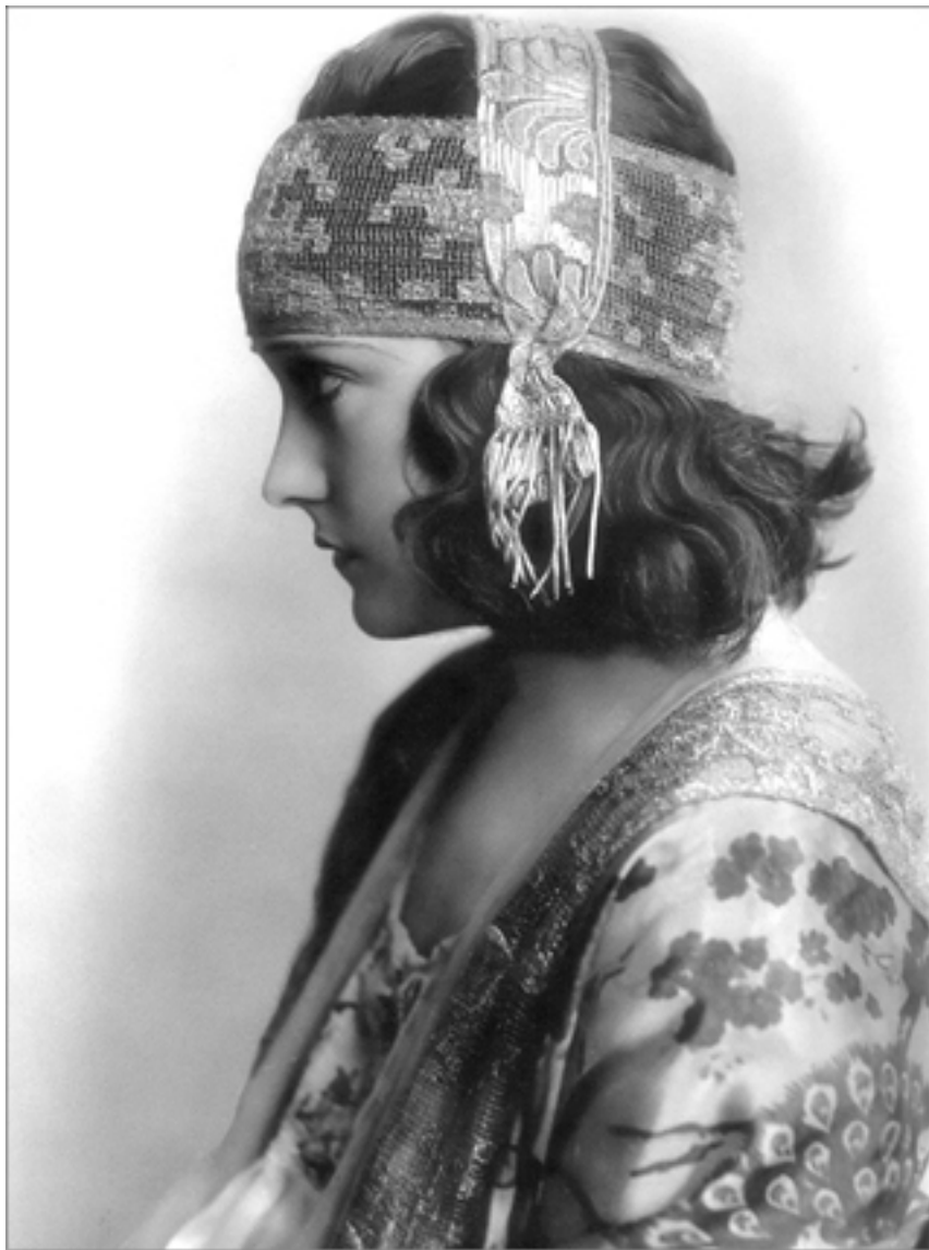
Глория Свенсон в 1919 г.

фильма не соответствовало настроению публики. Тут под откос пошли и отношения с Глорией, которая обнаружила, что, согласно их договору, прибыль от фильма, если она есть, делится между ней и Джо пополам, а вот убытки, в том числе полмиллиона долларов, выброшенные на «Королеву Келли», целиком идут за ее счет.