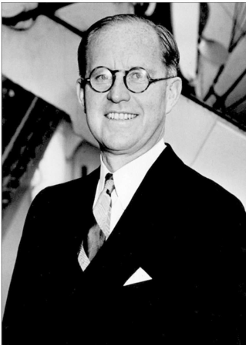
Джозеф Патрик Кеннеди

В 1992 году Джозеф Кеннеди-старший стал персонажем романа британского писателя и журналиста Роберта Харриса «Фатерланд», написанного в жанре альтернативной истории (два года спустя по роману был снят голливудский фильм). Действие романа происходит в 1964 году, но это совсем другой мир, чем он был в действительности в первый год после убийства президента Джона Кеннеди. В «Фатерланде» президент США тоже носил фамилию Кеннеди, но это не Джон, а его отец, посол Джозеф Кеннеди. В этой выдуманной реальности в 1942 году германские войска захватили Сталинград и Кавказ и отбросили Красную Армию за Урал. Остатки советских войск при американской поддержке продолжают вялотекущую, полупартизанскую войну за Уралом, которая длится и в 1964 году. Здесь Харрис развил мысль Гитлера, высказанную им в застольных беседах 29 августа 1942 года: «Иногда мне говорят: «Остерегайся! Тебе навяжут двадцать лет партизанской войны!» Я в восхищении от такой перспективы... Германия будет оставаться в состоянии постоянной боевой готовности». Эта цитата служит одним из эпиграфов к роману. Вся Европейская часть СССР вплоть до Уфы оккупирована немцами и превращена в германскую колонию. После того, как в 1944 году неудачей окончилась высадка в Нормандии, германские войска высадились на Британских