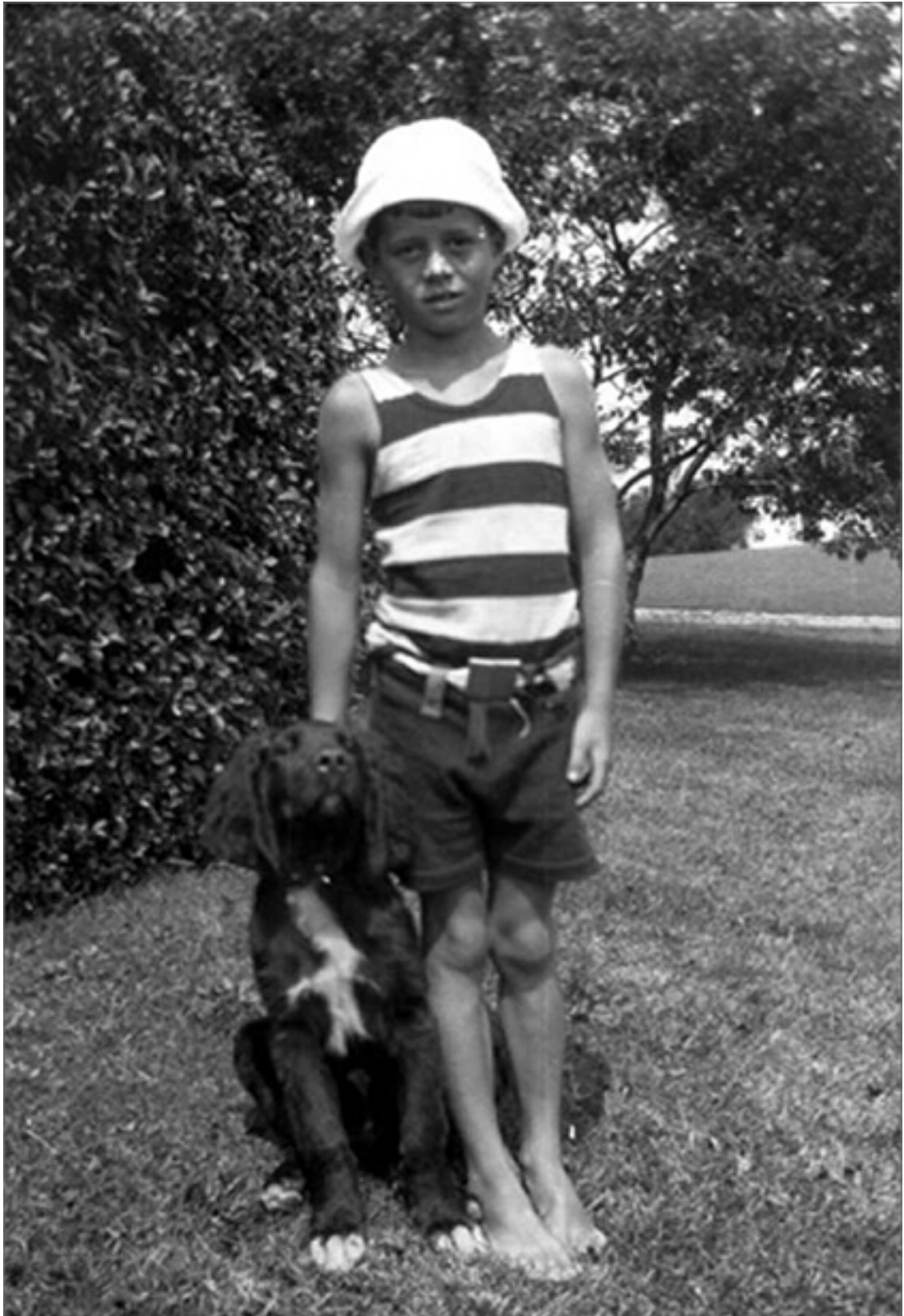
Джон Кеннеди в детстве

Бостонская элита с опаской относилась к Джозефу Кеннеди не только из-за его ирландских корней и католической веры, но еще и потому, что он слыл человеком грубым и беспощадным. Кроме того, многие считали верхом безвкусицы его нисколько не скрываемый роман со знаменитой актрисой Глорией Свенсон.