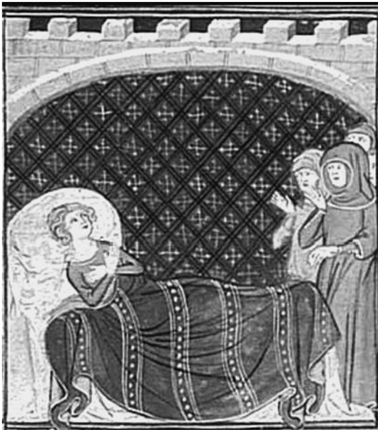
Гильом X на смертном одре. Средневековая книжная миниатюра

Согласно «Хронике Мориньи», Вильгельм прямо завещал