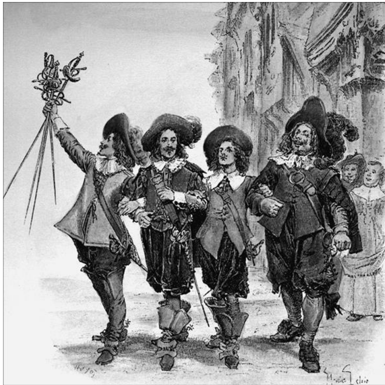
Три мушкетера. Художник М. Лелуар

Еще греко-римский историк и географ Страбон писал, подчеркивая родство аквитанов с иберами (обитателями Испании): «Далее... идет Трансальпийская Кельтика... Некоторые делили ее, например, на 3 части, называя ее обитателей аквитанами, бельгами и кельтами. Аквитаны, по сло-