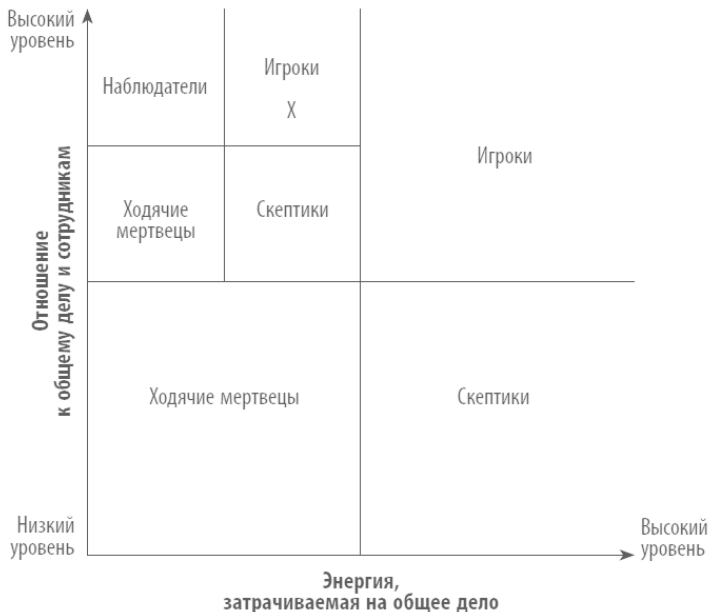
Рис. 2. Сектор наблюдателя-игрока (отмечен крестиком)

Тем не менее для такого типа работника не существует никаких препятствий для того, чтобы стать наблюдателем-игроком. Взгляните на рис. 2, и вы увидите, что верхний левый сектор разделен на четыре части, одна из которых отмечена крестиком – это и есть сектор наблюдателя-игрока. Бесспорно, думать и действовать одновременно сложно, но это вполне по силам многим.