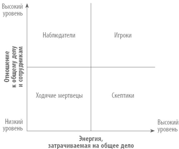
Рис. 1. Модель энергозатрат на работу

Модель представлена в виде двух осей (см. рис. 1), одна из которых (вертикальная) называется «Отношение к общему делу и сотрудникам». Чем лучше отношение работника к своим коллегам, тем дальше от исходной точки на вертикальной оси находится этот показатель. По такому же принципу на горизонтальной оси «Энергия, затрачиваемая на общее дело» измеряется объем энергии.