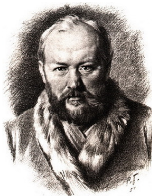
А. Н. Островский