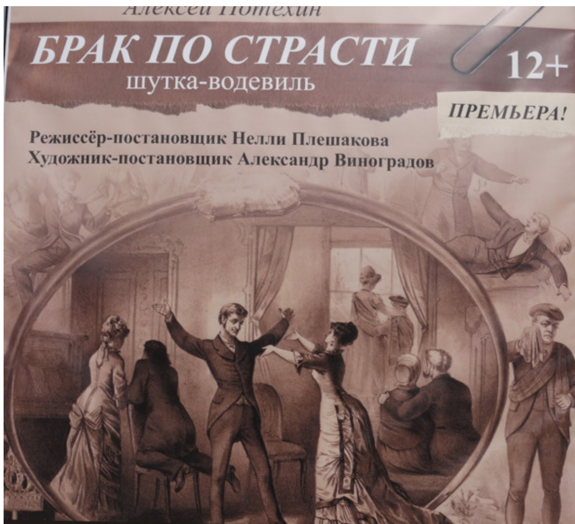
Театральная афиша г. Кинешма 2016 г.

В 2016 г. в Кинешме произошло другое знаковое событие. После столетнего забвения впервые на большую сцену вернули произведение А. А. Потехина. В Кинешемском драматическом театре им. А. Н. Островского была поставлена пьеса «Брак по страсти».