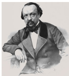
А. Ф. Писемский

В 1850 году А.А.Потехин поступил на службу к костромскому губернатору. Тут-то и состоялось его знакомство с А. Ф. Писемским. Алексей Феофилактович служил в это время в губернском правлении и уже приобрел довольно известное литературное имя. Писемский был человеком ироничным, склонным к скептицизму, беспощадным в приговорах и насмешках.