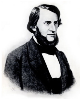
К. Д. Ушинский

В 1846 году А. А. Потехин стал студентом Ярославского Демидовского лицея, где на должности и.о. профессора камеральных наук состоял Константин Дмитриевич Ушинский. Многие во взгляде А. А. Потехина на русского человека, его природу сложилось под влиянием К. Д. Ушинского. Идеи Ушинского, как добрые семена, падали на подготовленную почву детской и юношеской любви к родному волжскому краю. Общение молодого профессора со своими учениками не ограничивалось лекциями. Педагог вовлекал студентов и в научную деятельность. За 1847—1848 учебный год Совет лицея присудил две золотые медали за студенческие работы, выполненные под руководством Ушинского. Одним из медалистов стал А. А. Потехин. Под руководством молодого профессора им были выполнены две обстоятельные научные работы: «Образование присутственных мест при Петре Великом» (отмечена золотой медалью) и «Опека и попечительство».