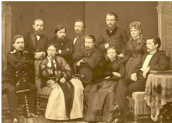
Семейное фото Потехиных (А. А. Потехин в центре)

Алексей Антипович Потехин родился в городе Кинешма Костромской губернии (ныне Ивановская область) 1 (14) июля 1829 года в старинной дворянской семье, весьма многочисленной и богато наделенной талантами. В метрических книгах Кинешемской Благовещенской церкви за 1829 г. значится актовая запись №8: