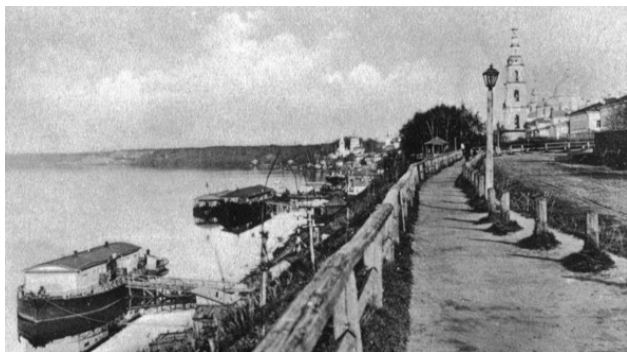
Вид Волги с бульвара г. Кинешма

Значительное место отведено описанию удовольствий и развлечений высшего круга – помещиков и чиновников, и незначительное – низшему. Тут мы встречаем тщательнейшие зарисовки танцевальных вечеров, «званных вечеров с закускою», святочных развлечений с ряжеными, различными обрядами, песнями и т. п. Писателя едва ли можно заподозрить в искусственности изображаемых сцен. Перед нами в живых картинах предстает незатейливое, довольно пустое и безалаберное времяпрепровождение «верхов общества» одного из больших уездных городов губернии.