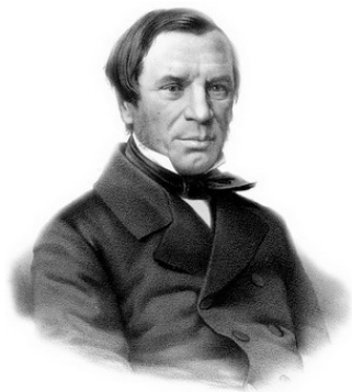
М. П. Погодин

На становление мировоззрения Потехина в пору московской жизни большое влияние оказал редактор «Москвитянина» М. П. Погодин. Много лет спустя он напишет о том, какую роль в его судьбе сыграл «друг Пушкина и Гоголя». Этот факт наставничества Погодина находит отражение в переписке его и Потехина.