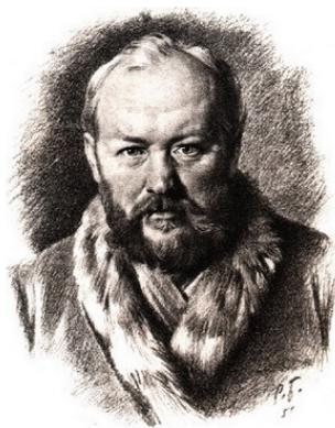
А. Н. Островский