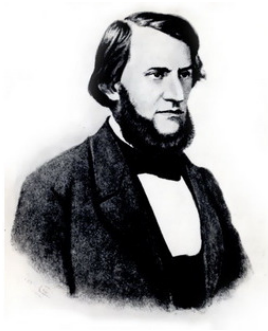
К. Д. Ушинский