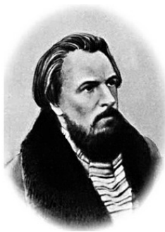
А. П. Григорьев

В 1852 году А. Потехин сближается с «молодой редакцией» журнала «Москвитянин».