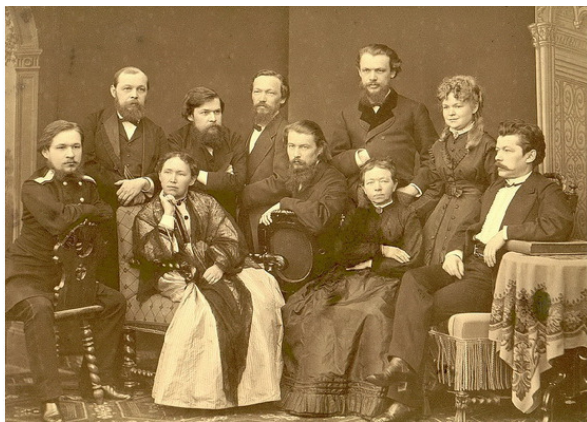
Семейное фото Потехиных (А. А. Потехин в центре)

Алексей Антипович Потехин родился в городе Кинешма Костромской губернии (ныне Ивановская область) 1 (14) июля 1829 года в старинной дворянской семье, весьма многочисленной и богато наделенной талантами. В метрических книгах Кинешемской Благовещенской церкви за 1829 г. значится актовая запись №8: