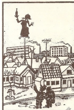
Рисунок С. КУЗЬМИНА

— Что ж ты, лопоухий, ворота плохо защищаешь!