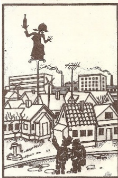
Рисунок С. КУЗЬМИНА

— Ieise namelys galima gauti deglines... Juozas GRIUSYS