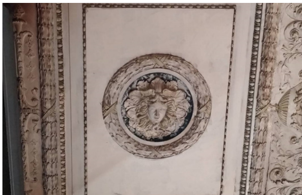
Розетка на потолке парадной