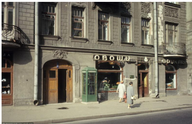
По домашнему уютный Кировский. 1950.