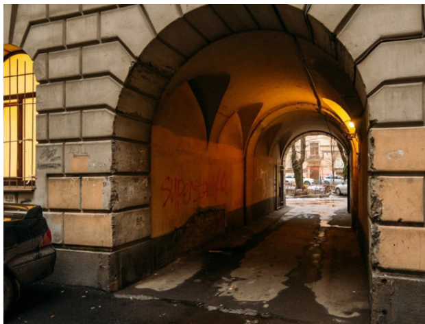
Переход на задний двор

Лёшенька подрос настолько, что мама стала посылать его в булочную за хлебом. Поручение не обременительное, тем более, что булочная находилась рядом, в том же квартале, где и дом, в котором жил Лёшка.