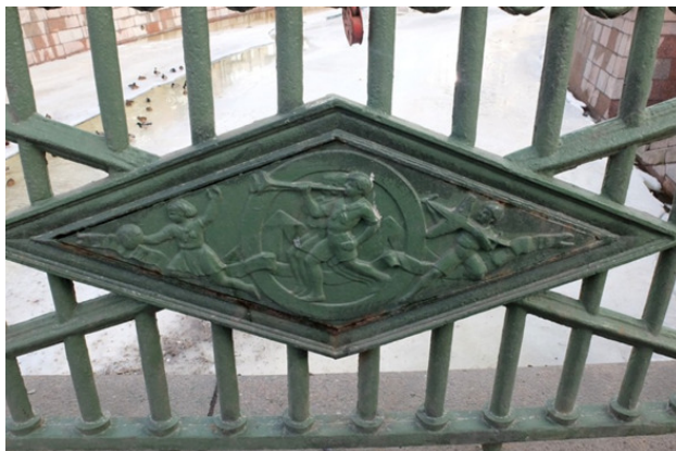
Декоративная деталь Пионерского моста