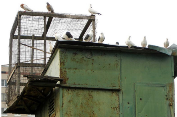
Голубятня на гараже