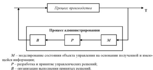
Рис. 1.1. Сущность процесса администрирования

В широком смысле понятие «public administration» включает всю систему административных институтов с достаточно строгой иерархией власти, посредством которой ответственность за выполнение государственных решений спускается сверху вниз посредством приказов и распоряжений. Понятия «управление» и «администрирование» в России традиционно воспринимаются как синонимы, что отражает общую природу, субъектно-объектное единство, однородность сущности и содержания подразумеваемого воздействия. В широком смысле такой подход не только возможен, но и необходим, поскольку обеспечивает простоту обозначения и единую основу восприятия социально-экономических процессов. Однако, понятия «государственное и муниципальное управление» и «государственное и муниципальное администрирование» существенно отличаются по сути решаемых задач в системе управления территорией (страной, регионом, муниципальным образованием). Взаимосвязь понятий наглядно представлена на рис. 1.1.