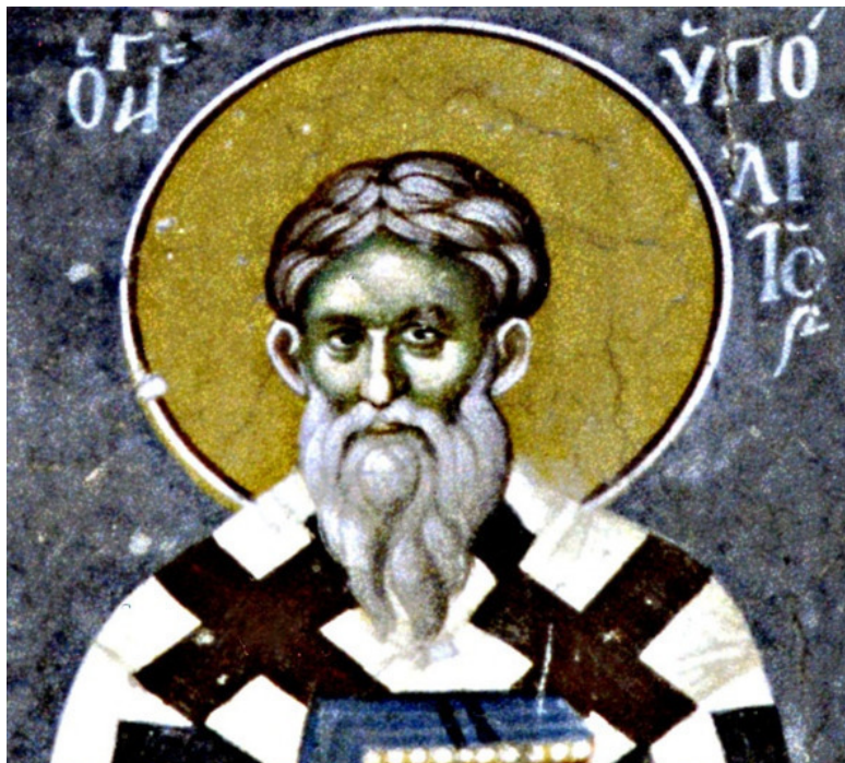
Св. Ипполит Римский, епископ Остиумский: «Это великая тайна самофракийцев, хранителей известного мистериального культа, которая известна лишь посвященным. Они могут с достоверностью сообщить об Адаме как о своем прачеловеке» (трактат «О Воскресении — против иудеев», III век по Р.Х.).

ния – земля сынов Ария . Так что они действительно могли «с достоверностью сообщить об Адаме как о своем прачеловеке», как это написал о них в трактате «Против иудеев» епископ Остиумский. (Подробнее в книге " Арий Гипербореийский, праотец... ")