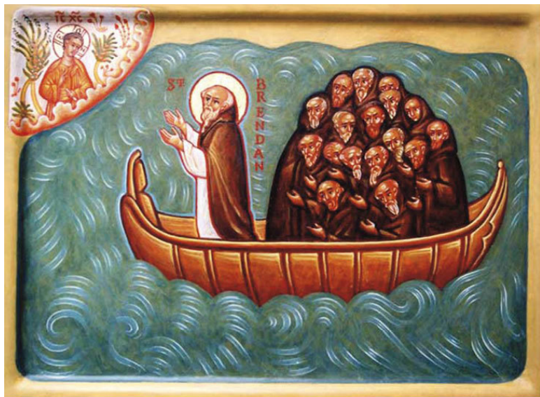
Плавание аббата Брендана

Одна из самых старинных историй про использование спины кита вместо суши содержится в сказании «Плавание святого Брендана». В начале двадцатых годов VI века ирландский аббат Брендан вместе с небольшой командой, состоявшей из одних монахов, отправился по морю на запад в поисках рая. Их небольшое парусное судно было сделано из бычьих шкур. В графстве Кэрри в Ирландии до сих пор делают подобные лодки. Они называются «каррак».