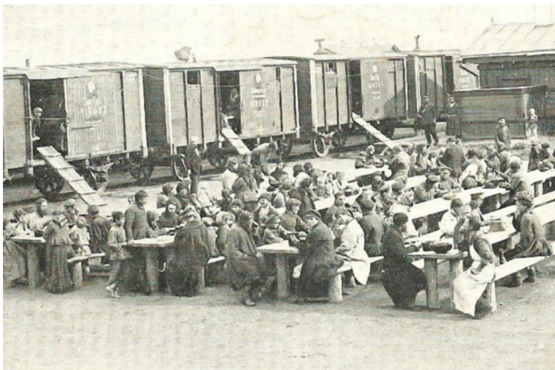
Перевалочный пункт дороги Украина-Сибирь. Обед.

Вдоль всей железнодорожной ветки, в крупных городах, были организованы специальные переселенческие пункты. Пока поезд стоял на станции, нужно было успеть сходить в столовую, в баню, постирать бельё. Большинство услуг были бесплатны.