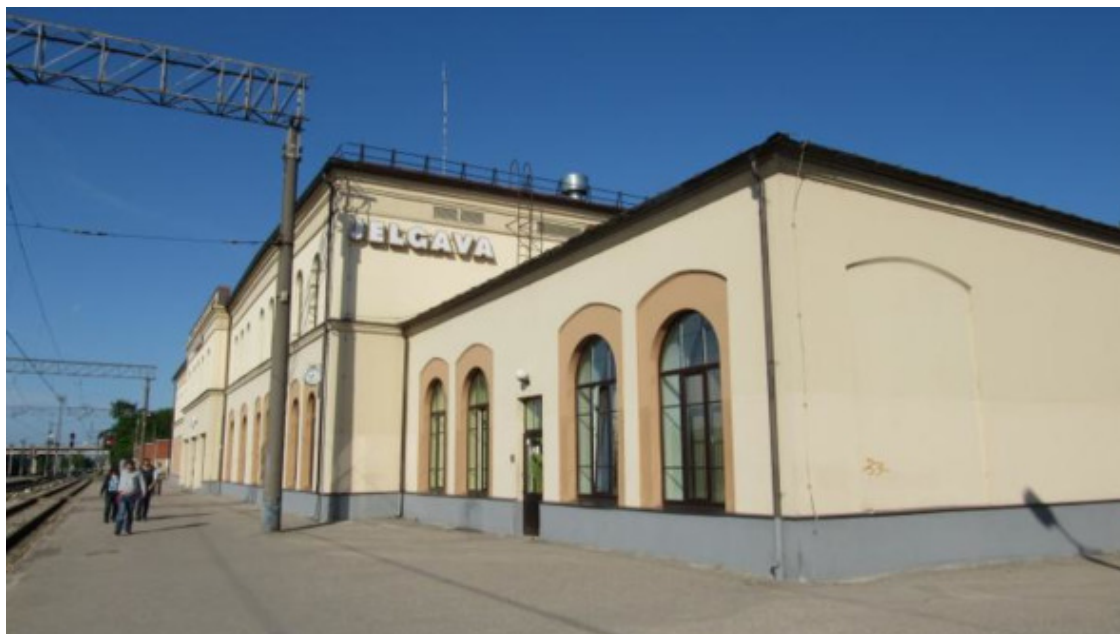
Елгава. Железнодорожный вокзал

Лешку скрючило на вокзале в Елгаве: резкая боль накатами набрасывалась на желудок. Лешка громко стонал, почти кричал. Беспризорная братия живо подхватила его и понесла к стоявшему на втором пути санитарному поезду.