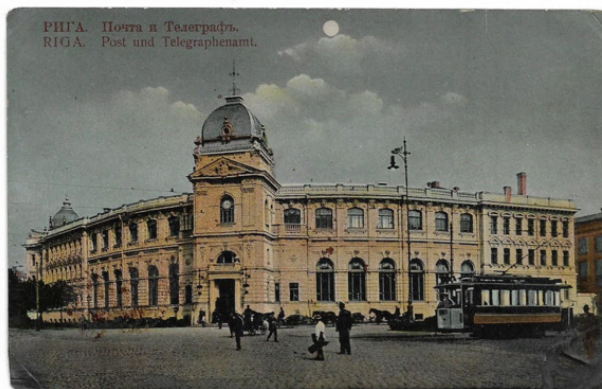
Рига. Почта и Телеграф. Старинная открытка