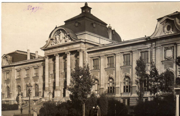
Здание художественного музея