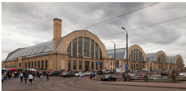
Рижский Центральный рынок

Лешка в своих солдатских сапогах, в грязном, прожженном в нескольких местах ватнике, в мятой шапке совсем не вписывался в чистую среду латышского рынка. Торговки поглядывали на него явно неприязненно. Нужно было сваливать.