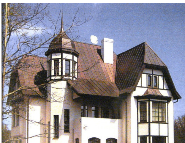
Особняк на улице Баложу.