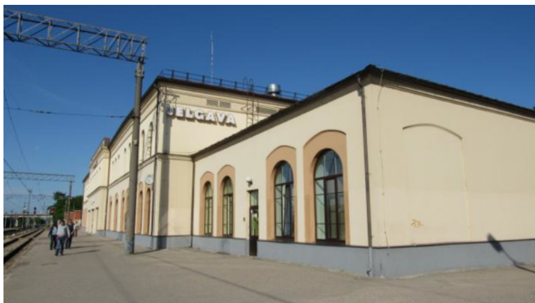
Елгава. Железнодорожный вокзал

Лешку скрючило на вокзале в Елгаве: резкая боль накатами набрасывалась на желудок. Лешка громко стонал, почти кричал. Беспризорная братия живо подхватила его и понесла к стоявшему на втором пути санитарному поезду.