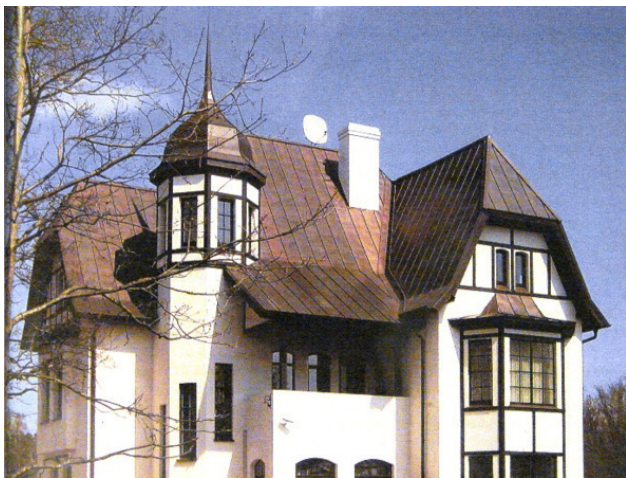
Особняк на улице Баложу.

Все они были воришками. Без этого беспризорнику не выжить. Все они знали как достать пищу, как разжалобить тетеньку, как устроиться на ночлег. Они еще не ботали по фене, но пересыпали свою речь словечками, распространенными в преступной среде.. Они еще не стали урками, блатными, но к этому стремились. Во всяком случае старались подражать взрослому ворю.