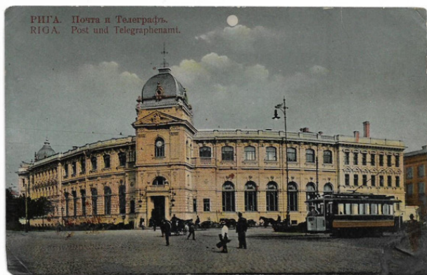
Рига. Почта и Телеграф. Старинная открытка