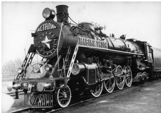
Паровоз серии ИС