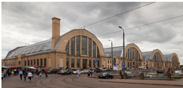
Рижский Центральный рынок

С базаром получился полный облом. Рижский рынок был совсем не похож на российские рынки. Много света и простора. Чистота, аккуратность. Продавщицы в белых фартуках.