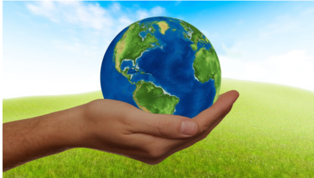
Рис. 2. Устойчивость Земли

Необъятные просторы Родины заманчивы, но мне милее всего место моего рождения недалеко от столицы России возле города Москва, которому в 1997 году исполнилось 850 лет. В одном из посёлков Подмосковья на улице Солнечной в девятиэтажном блочном железобетонном тереме для 105 семей на третьем этаже в трёхкомнатных палатах с мамой, папой, сестрой Наташей, котом Тихоном прошли мои школьные и студенческие годы.