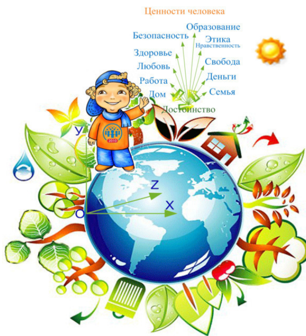
Рис. 1. Человек ориентированный

Первую систему координат для ориентации в пространстве ввёл в 17 веке Рене Декарт – французский учёный. По сходной с ней географической системе координат я определился, что живу на необъятных просторах Европы и Азии, среди лесов, полей и рек, на территории тысячелетнего государства, с названием Россия.