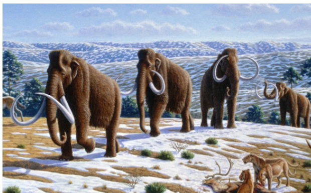
Рис. 5. Мамонт похож на слона

Некоторые учёные считают, что эти шапки льда однажды были причиной изменения оси вращения Земли, резкого повышения уровня мирового океана, изменения климатических зон и местонахождения Северного и Южного полюсов.