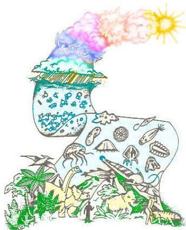
Рис. 4. Появление жизни, рисунок из книги Маклина Глена

В ходе зарождения наша Земля, как и другие планеты, была огненным шаром, так как при сжатии космическая пыль и газ сильно разогрелись, а потом наш шар земной стал остывать, и его поверхность затвердела.