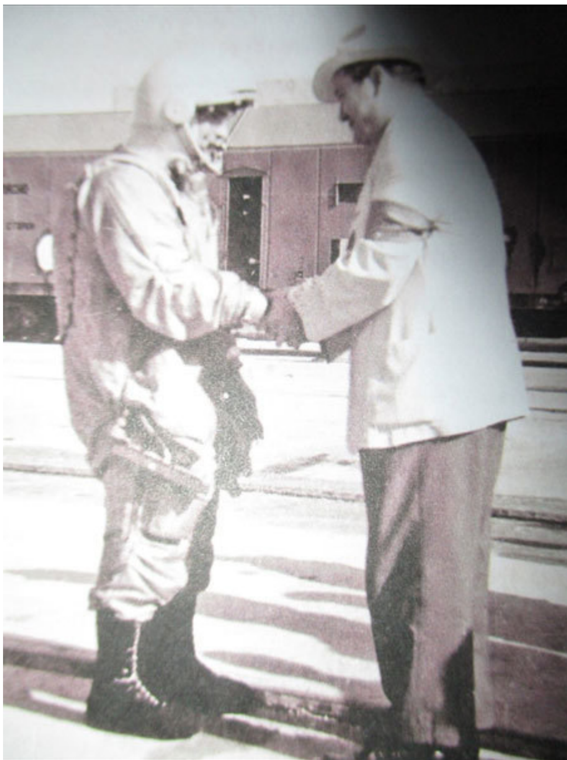
ФОТО: Г.С. ТИТОВ И ПРЕДСЕДАТЕЛЬ ГОСУДАРСТВЕННОЙ КОМИССИИ ПО КОСМИЧЕСКИМ ПОЛЁТАМ Л.В. СМИРНОВ ПЕРЕД СТАРТОМ. 6 АВГУСТА 1961 ГОДА