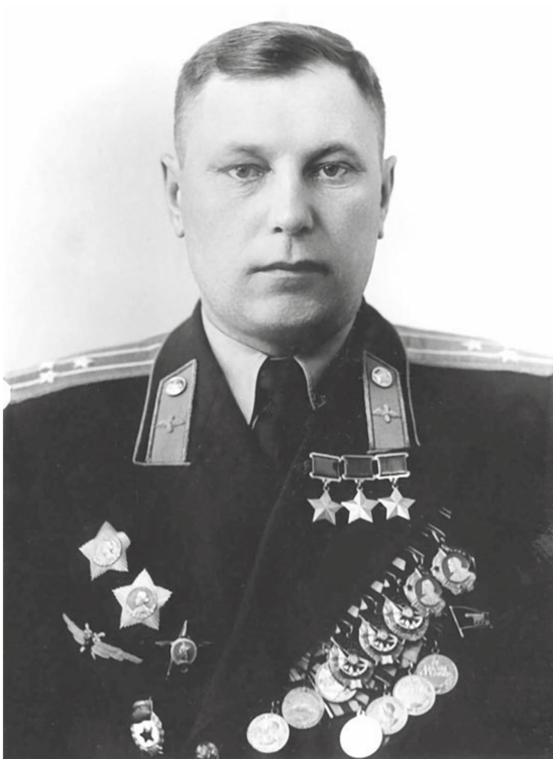
Трижды Герой Советского Союза А. И. Покрышкин. Фото второй половины 40-х годов

– А что, – говорит Молотов, – у солдат каждое звание имеет очень большое значение. Здоровье как? – спрашивает он у Покрышкина.