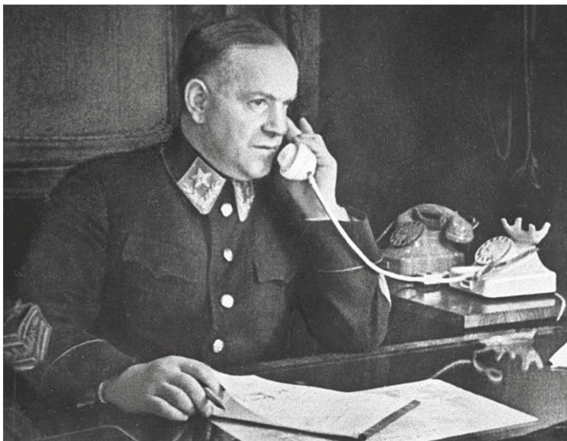
Маршал Г.К. Жуков

– Каждый здесь хочет снять с себя ответственность, – говорит Молотов. – Однако Кузнецов, моряк, морской министр, дал с вечера двадцать первого на двадцать второе июня указание быть готовым к авиационному налету. Жуков этого не сделал. Кузнецов храбрится, что он сделал по своей инициативе. В данном случае он оказался более прав, потому что от него не требовалось полной проверки, а от Генштаба она требовалась, и Генштаб находился под такого рода указанием, что – не торопись, проверяй, прежде чем принимать те сообщения на веру, которые к нам приходили в самые последние минуты перед началом войны. И тут задержка, известно, была, но она ничего не решала.