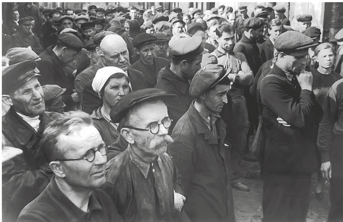
Люди слушают обращение Молотова. 22 июня 1941 года

– А речь третьего июля он готовил или политбюро?