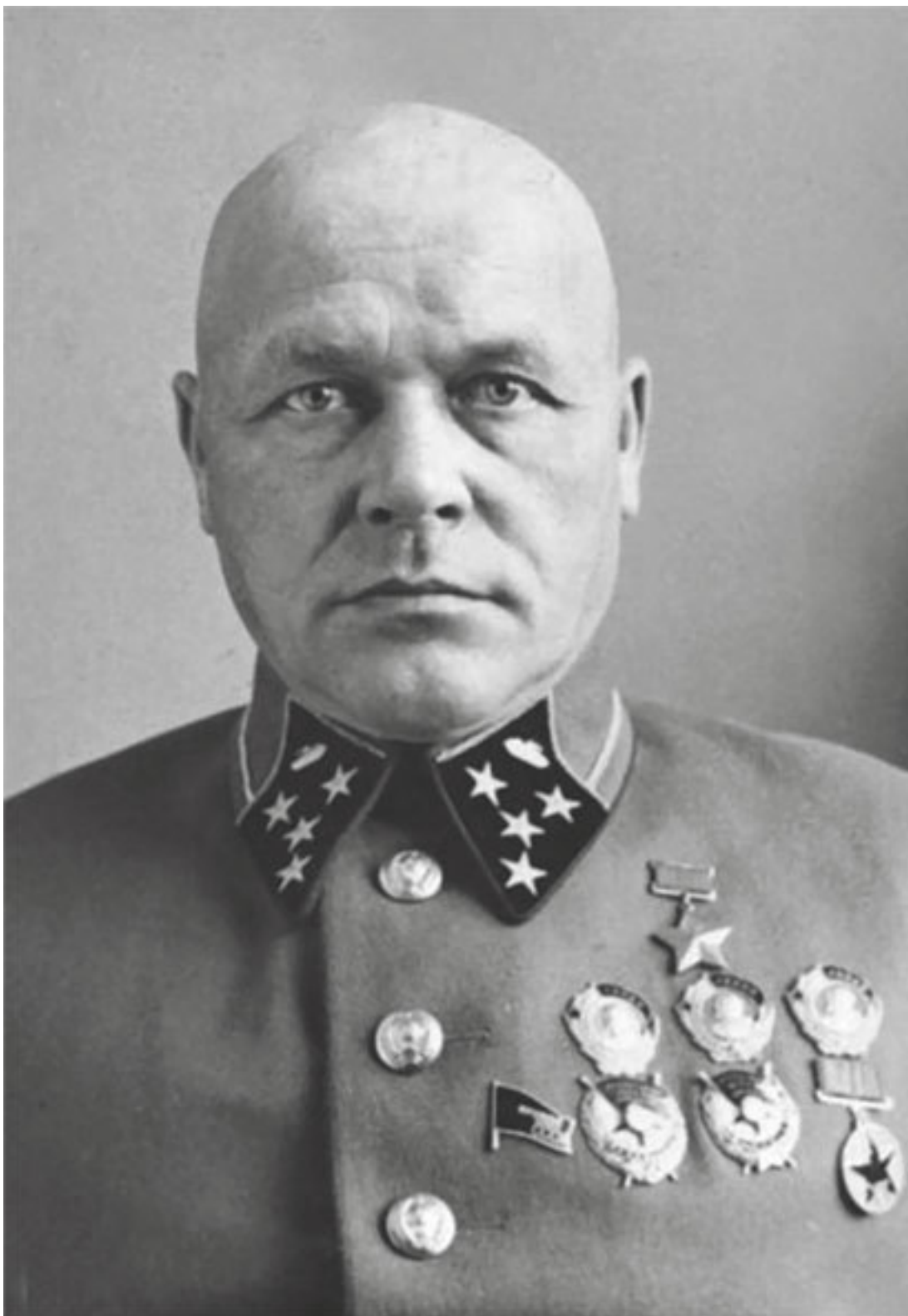
Герой Советского Союза генерал-полковник танковых войск Д. Г. Павлов

...Я говорю Молотову о том, как маршал Голованов рассказывал мне, что он лично был свидетелем разговора Павлова со Сталиным по телефону в кабинете Павлова, когда до начала войны оставались считанные недели. Сталин предупреждал о возможном нападении, но по разговору чувствовалось, что Павлов, находясь почти на границе, как ни парадоксально, не принимает всерьез это предупреждение.