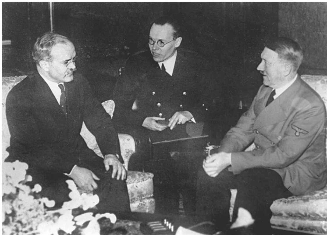
Встреча Молотова с Гитлером в Берлине. Ноябрь 1940 года