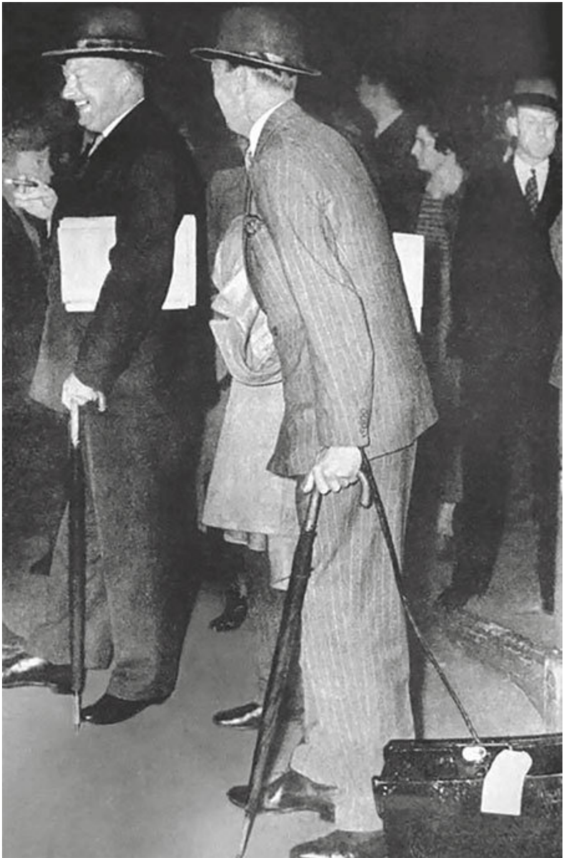
В начале августа 1939 года английская и французская военные миссии приехали в Москву для переговоров с Советским Союзом. На фотографии адмирал Реджинальд Дракс и генерал Жозеф Думенк