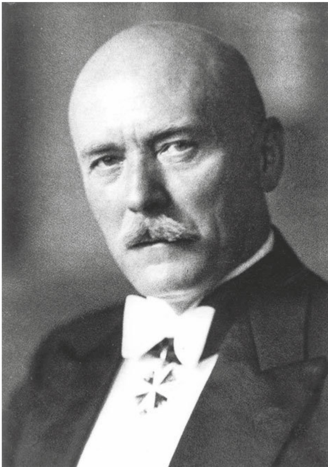
Фридрих-Вернер фон дер Шуленбург

– Но Жуков пишет, что разбудил Сталина и доложил, что бомбят. Значит, уже в час ночи бомбили?