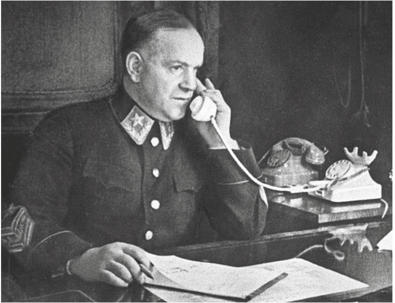
Маршал Г.К. Жуков

мать те сообщения на веру, которые к нам приходили в самые последние минуты перед началом войны. И тут задержка, известно, была, но она ничего не решала.