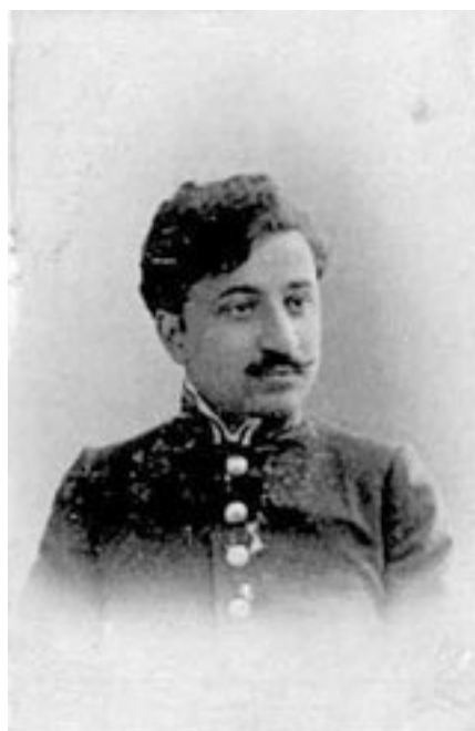
Студент 1 го курса юрфака Лейпциг- ского Университета 1905 г.