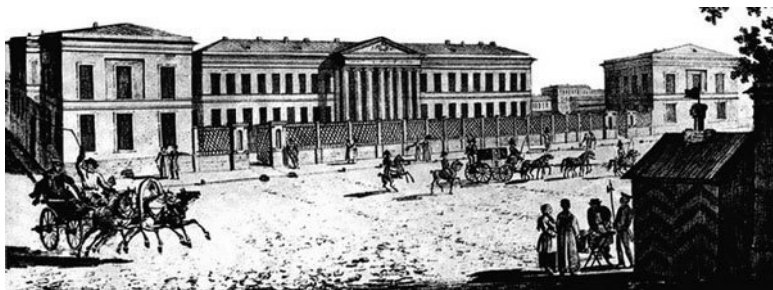
Мариинская больница (Москва)

Впоследствии она получила название «Мариинская больница» .