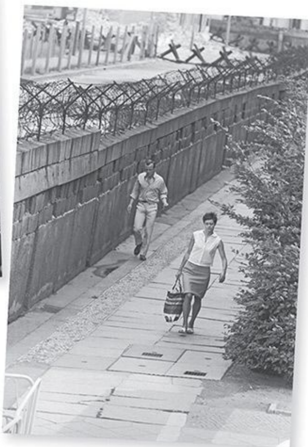
Строительство Стены, разделившей город на две части. Берлин 1961