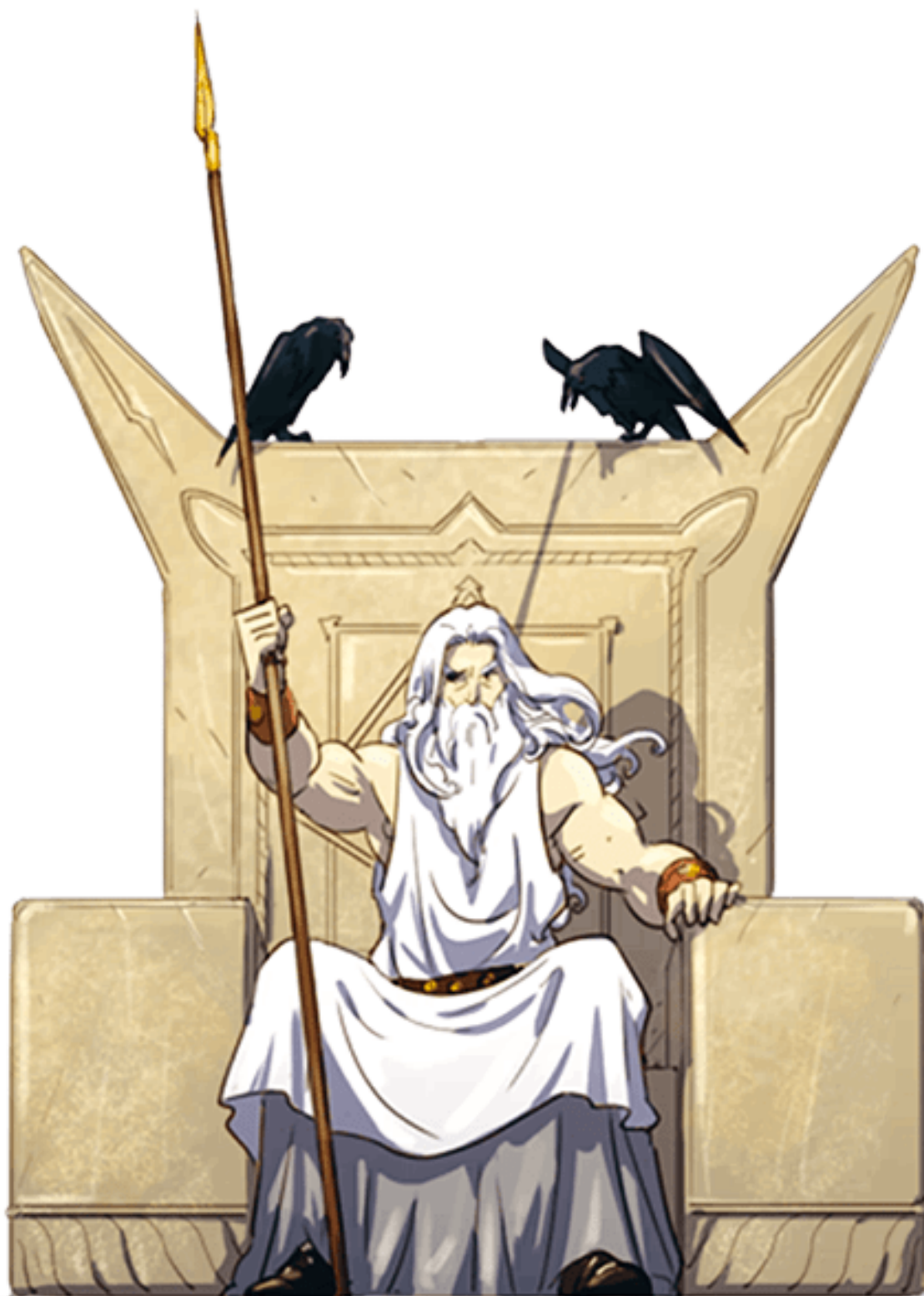
Фригга – царица Асгарда. Богиня супружества и материнства, славившаяся своей добротой.